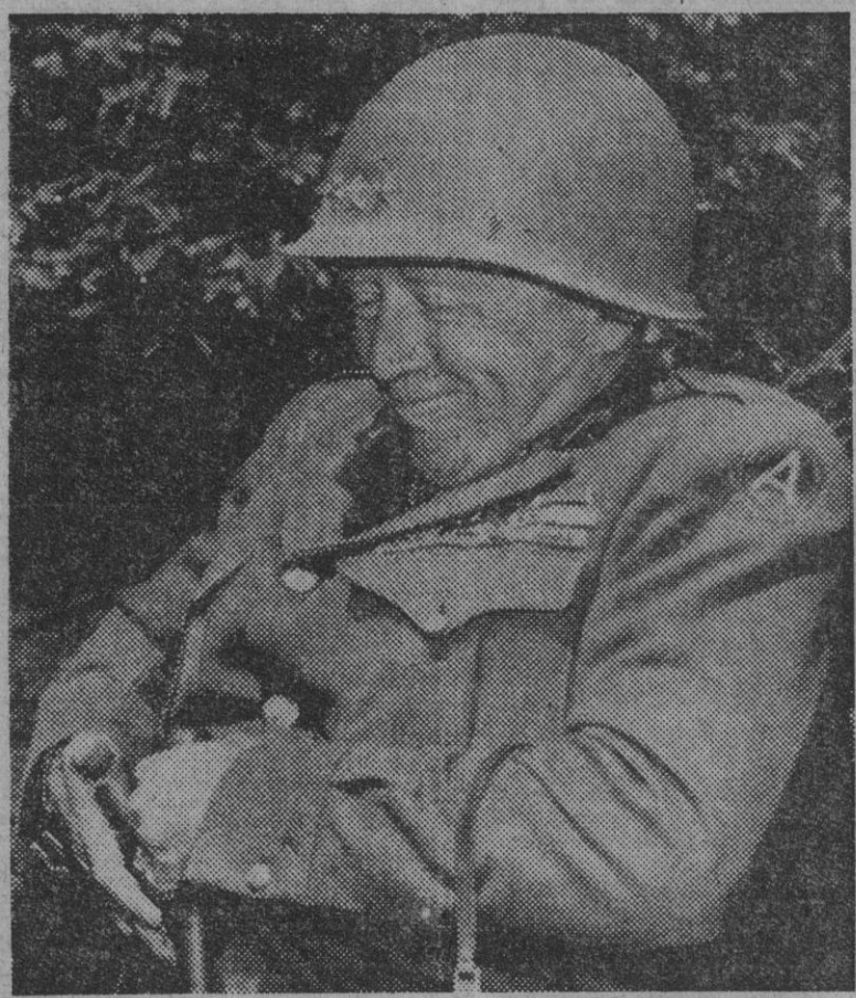
El teniente general George S. Patton, jefe del III ejército americano, sonríe mientras mete su nueva pistola en la funda.