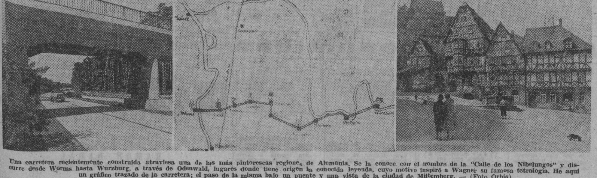
Una carretera recientemente construida atraviesa una de las más pintorescas regiones de Alemania. Se la conoce con el nombre de la "Calle de los Nibelungos" y discurre desde Worms hasta Wurzburg, a través de Odenwald, lugares donde tiene origen la conocida leyenda, cuyo motivo inspiró a Wagner su famosa tetralogía. He aquí un gráfico trazado de la carretera; el paso de la misma bajo un puente y una vista de la ciudad de Miltenberg.