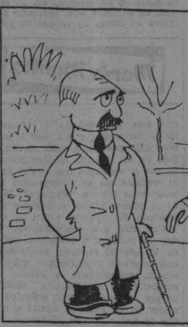
— Mi vecino murió como un pajarito. — ¿En la cama? — No, En un árbol. Estaba robando manzanas.