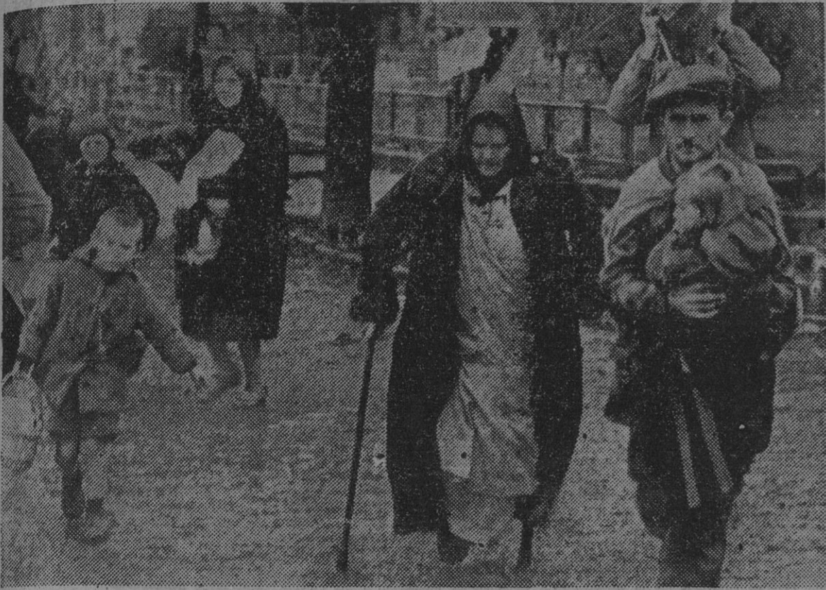
La población civil del territorio húngaro, ocupado por los soviets, huyendo del terror belchevique