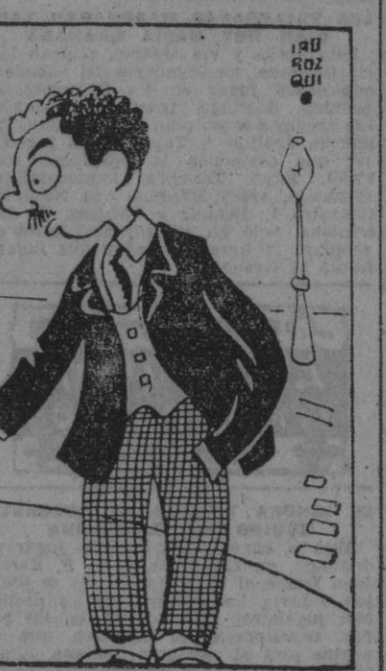
— Mi vecino murió como un pajarito. — ¿En la cama? — No, En un árbol. Estaba robando manzanas.