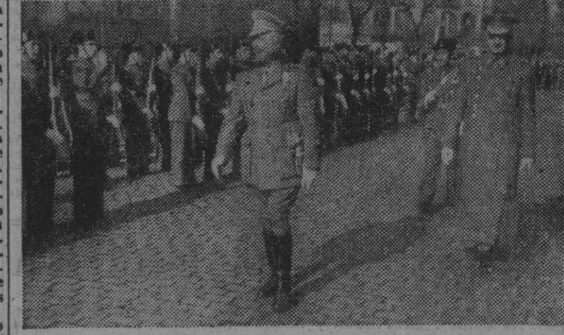
El Excmo. señor general don Camilo Alonso Vega, director general de la Guardia Civil, visitando a las fuerzas que la han rendido honores a su llegada a nuestra ciudad.