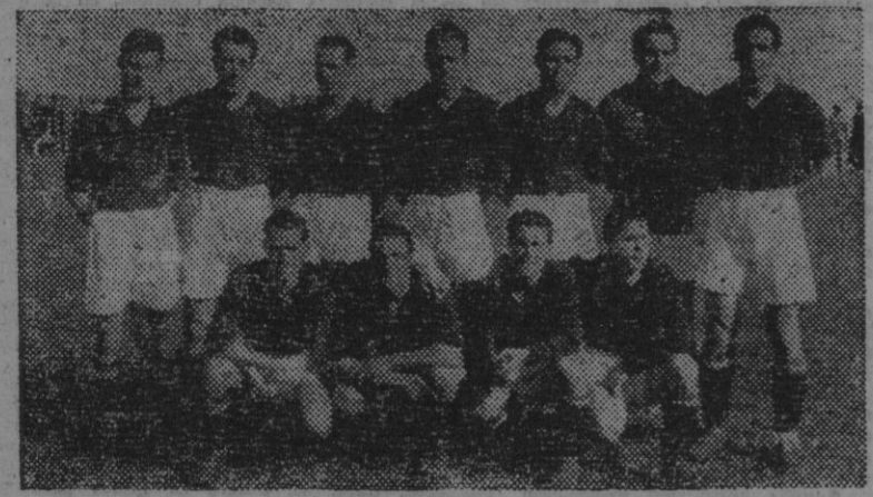
He aquí al conjunto de preseleccionados que jugaron ayer en el Estadio Metropolitano...