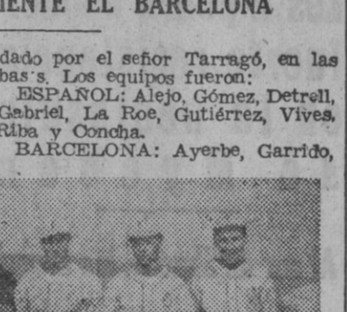
El equipo del R. C. D. Español de Peñeta Base, vencedor del Trofeo Jordá.