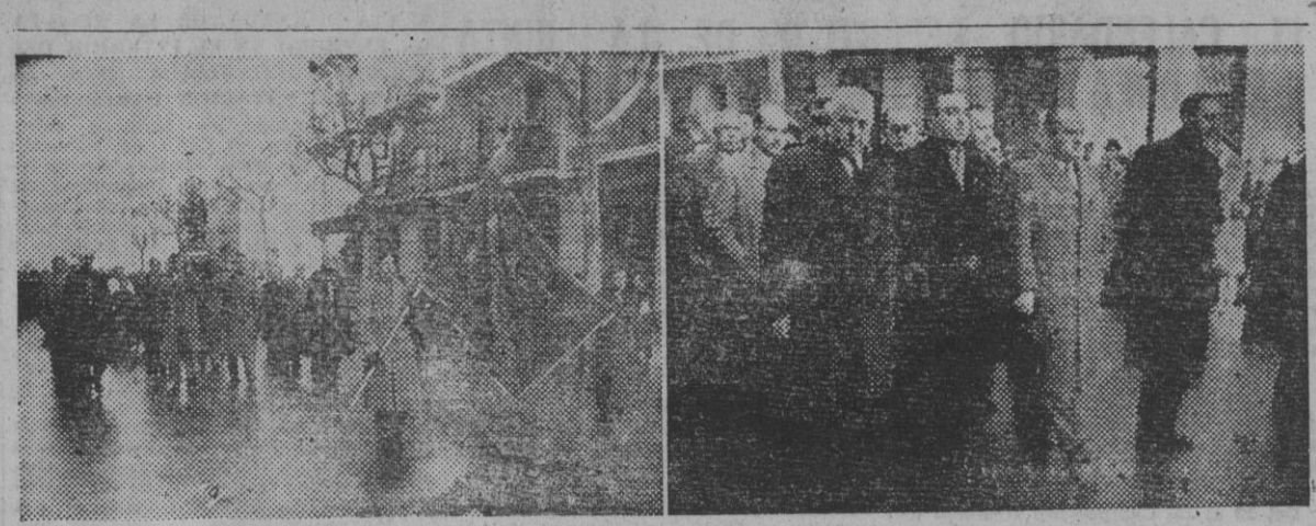
Los vendedores del Mercado de San Antonio, de nuestra ciudad, presididos por autoridades barcelonesas, celebraron ayer una procesión para trasladar la bandera del Grmío desde la Iglesia de la Piedad...