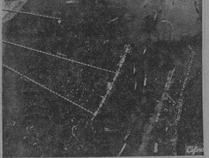
Vista panorámica de uno de los puertos artificiales improvisados por los ingenieros de las fuerzas aliadas en las costas francesas, para sustituir a los que destruyeron las tropas alemanas en su retirada.