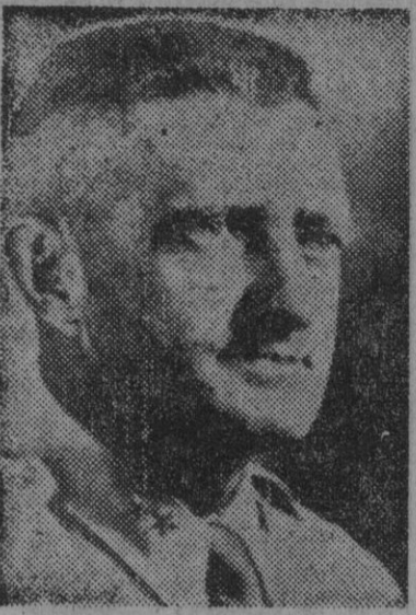
El general de división John Reed Hodge, que manda el XXIV Cuerpo de ejército norteamericano, que opera actualmente en las Filipinas (Foto recibida por radio)