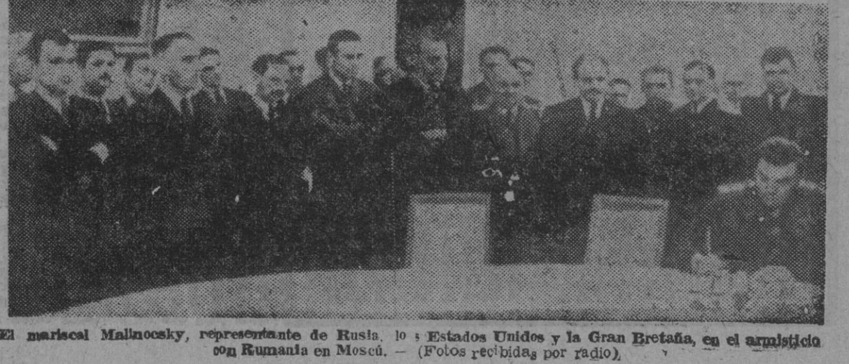
El mariscal Malinovsky, representante de Rusia, con Estados Unidos y la Gran Bretaña, en el armisticio con Rumania en Moscú. — (Fotos recibidas por radio)