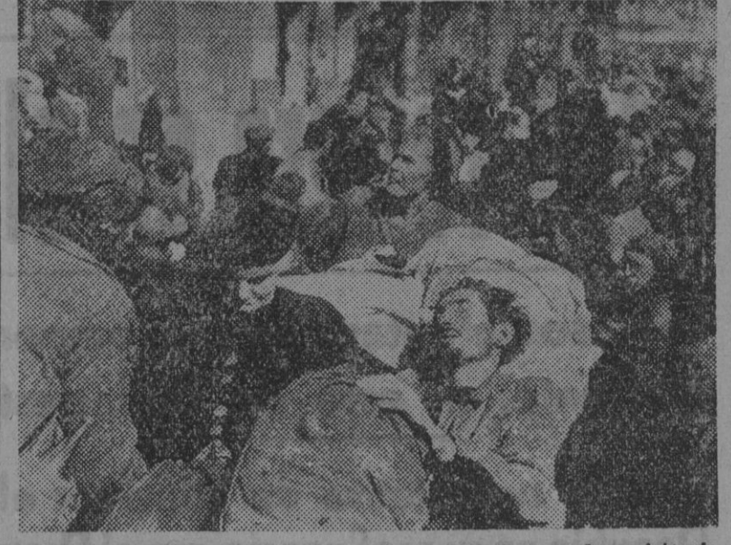
Indecibles durlos y miserias han padecido las fuerzas de resistencia durante tan dilatada batalla. Un aspecto de la población civil fuera ya de los angostos refugios.