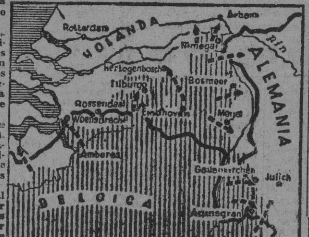
Y península artificial de Walcheren y Beveland y demás que cierran la salida del Escalda navegable, rebaseadas en muchos kilómetros durante los avances efectuados en el mes de septiembre.

BERLIN, 31. — El Alto Mando alemán comunica: «Nuestras guarniciones de puntos de apoyo dejados en algunas islas del mar Egeo, después de la evacuación de Grecia, libran combates en las islas de Milos y Piskopi, contra las fuerzas enemigas desembarcadas. — Efe.