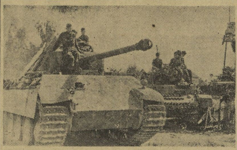
Después de un combate, los carros de asalto alemanes se reúnen para marchar hacia sus nuevas posiciones en el sector meridional del frente del Este.