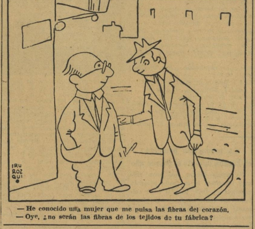
— He conocido una mujer que me pulsa las fibras del corazón. — Oye, ¿no serán las fibras de los tejidos de tu fábrica?