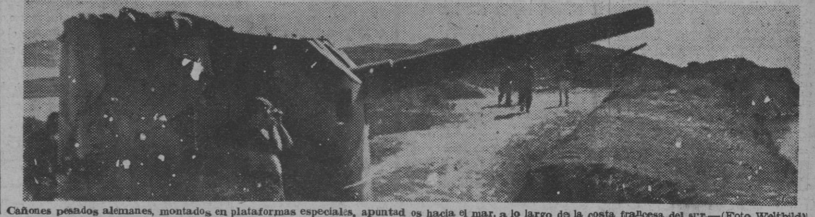
Cañones pesados alemanes, montados en plataformas especiales, apuntados hacia el mar, a lo largo de la costa francesa del sur.