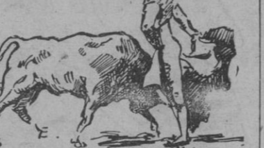
"Parrita" en una media verónica