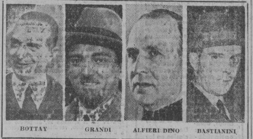
BOTTAY GRANDI ALFIERI DINO BASTIANINI