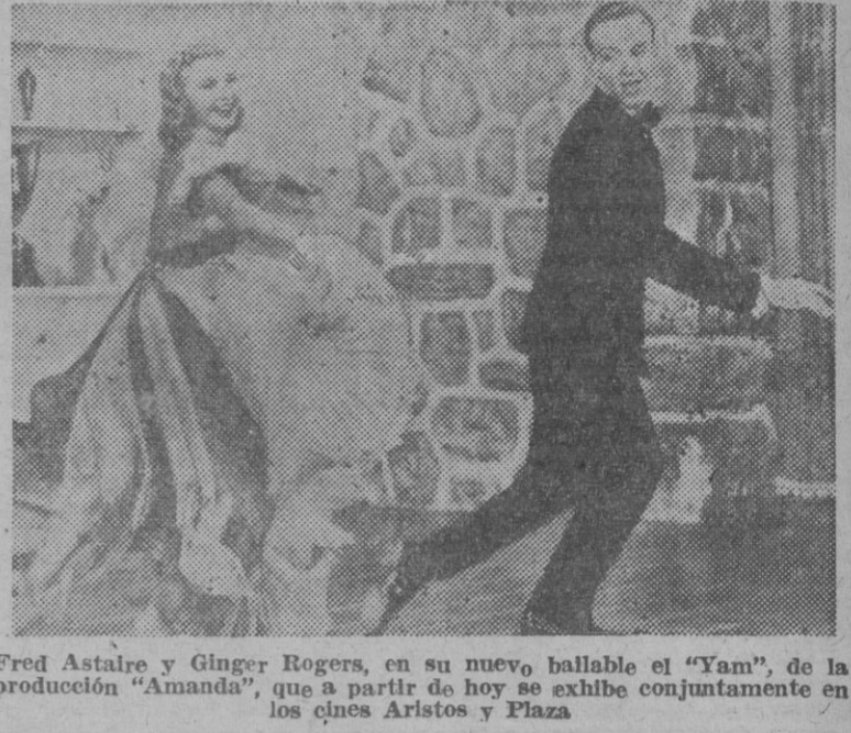
Fred Astaire y Ginger Rogers, en su nuevo baile el «Yam», de la producción «Amanda», que a partir de hoy se exhibe conjuntamente en los cines Aristos y Plaza