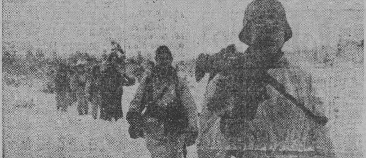
Granaderos alemanes ocuparon, después de duros combates, una parte de la ciudad de...