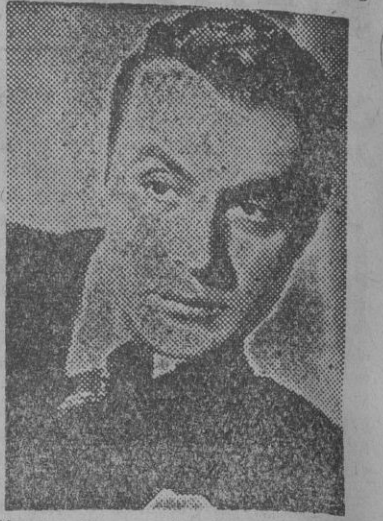
Charles Boyer, el galán francés, incorporado al cine americano...