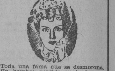
Toda una fama que se desmorona. Un hombre perdido en la inmensidad de su culpa

Hoy y mañana, tarde, últimas proyecciones en su QUINTA SEMANA de éxito de «EL ESCANDALO»