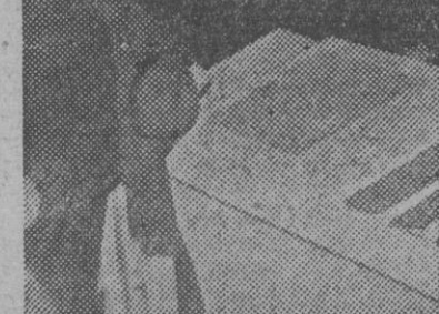
El jefe del Estado portugués, general Carmona, inaugura la Exposición Bibliográfica Agronómica, con motivo del Primer Congreso de Ciencias Agrarias.