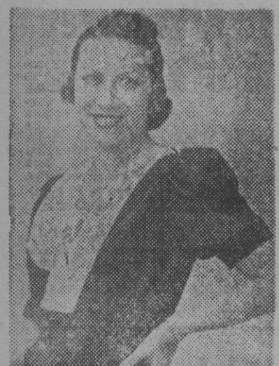
Montserrat Blanch, notable y bella actriz de la Compañía de Irene López Heredia