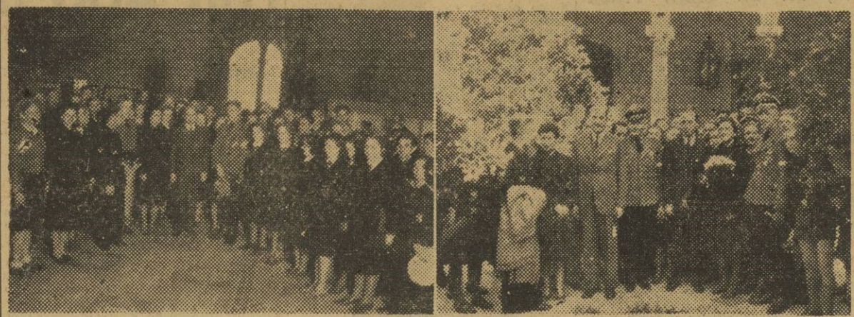
Se encuentra en nuestra ciudad un coro mixto de las Juventudes Alemanas. En la mañana de hoy han visitado el Ayuntamiento y la Diputación Provincial. He aquí a sus componentes en el Salón de Ciento y en el Patio de los Naranjos.