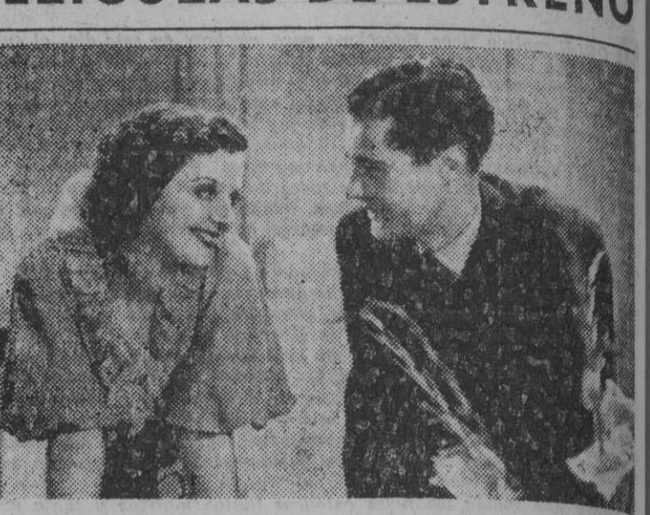
Basil Sydney y Margot Grahams, principales figuras, con Paul Cavanagh, de la superproducción United Artists que presentada por Hollywood Films se estrenará el próximo lunes en los salones Capitolio y Metropol

M. FERNANDA LADRÓN DE GUEVARA ROSAS de OTOÑO CIFESA