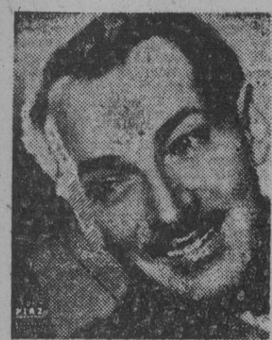
Rougemont, autor de la producción 'Noches de París que por la compañía 'Des Ambassadeurs de Paris, será estrenada esta noche en el Teatro Gómcio