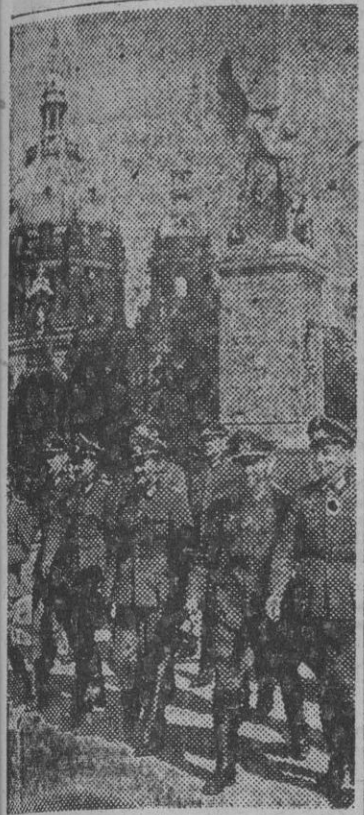
Grupo de combatientes de la "División Azul", en viaje de permiso por Alemania, saliendo de visitar la Catedral de Berlín