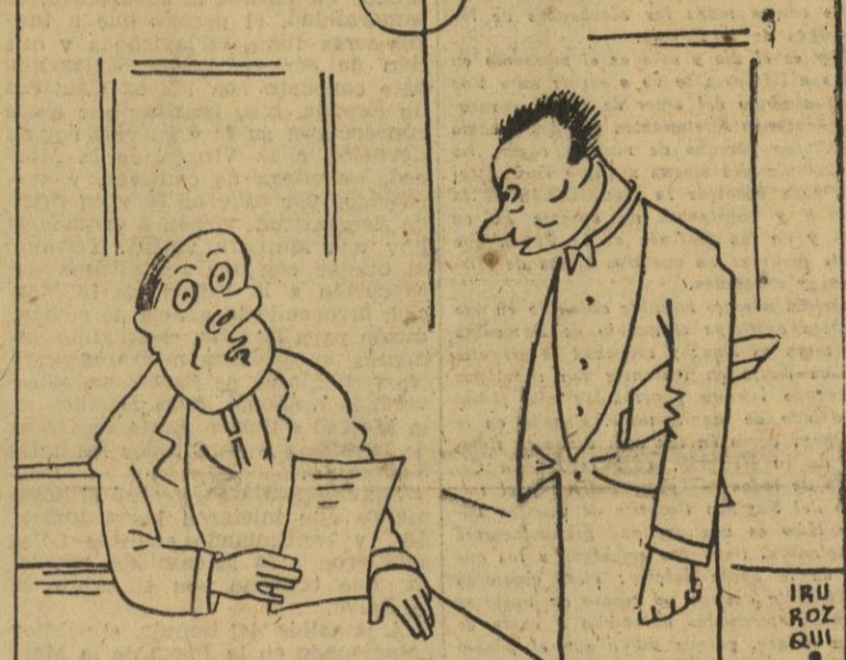
¿Tiene macarrones a la italiana? — Sí, señor; con salchichas de Francfort son estupendos.