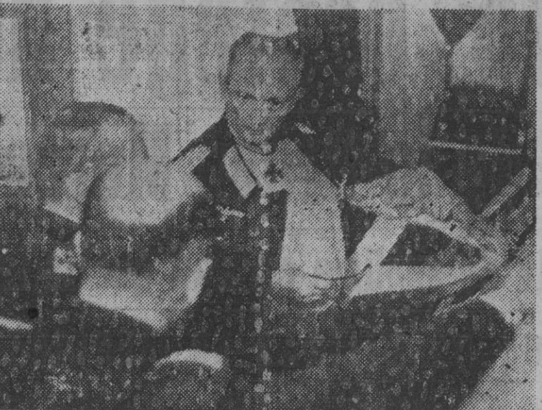
El mariscal von Kluge, herido en un brazo durante una visita efectuada al frente, ha sido condecorado con las Hojas de Eucalypto de la Cruz de Caballero. Con el miembro herido, cuidadosamente acondicionado, reanuda el servicio.