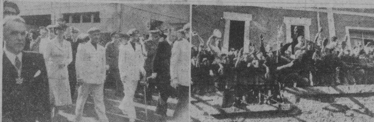
I. S. E. el Jefe del Estado, Generalísimo Franco, acompañado de su esposa y séquito, se dirige a pie a visitar la Universidad de Oñate...