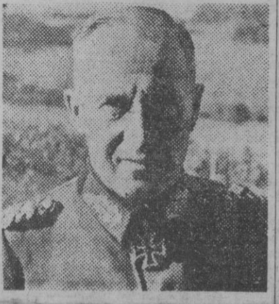
El general Hans, condecorado por Hitler con las Hojas de Encina de la Cruz de Caballero.