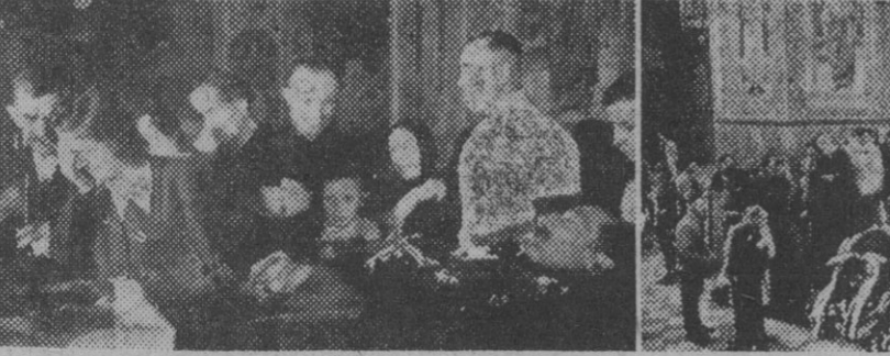
El pueblo de Bulgaria, que profesaba hondo cariño a 1 rey Boris, ha tenido ocasión de tributar su último homenaje al monarca fallecido...