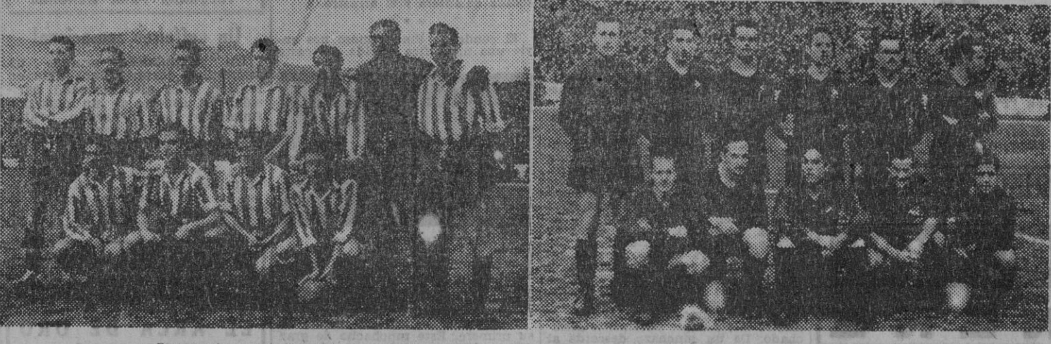
Los equipos del Español y Barcelona, que ayer jugaron en Casa Rabla.

Se reanuda el juego tras el descanso con un buen servicio de Rosalench y el árbitro señaló golpe franco contra el Barcelona. Se forma la correspondiente barrera y dispara Barceló rebotando el balón en los cuerpos de los jugadores.