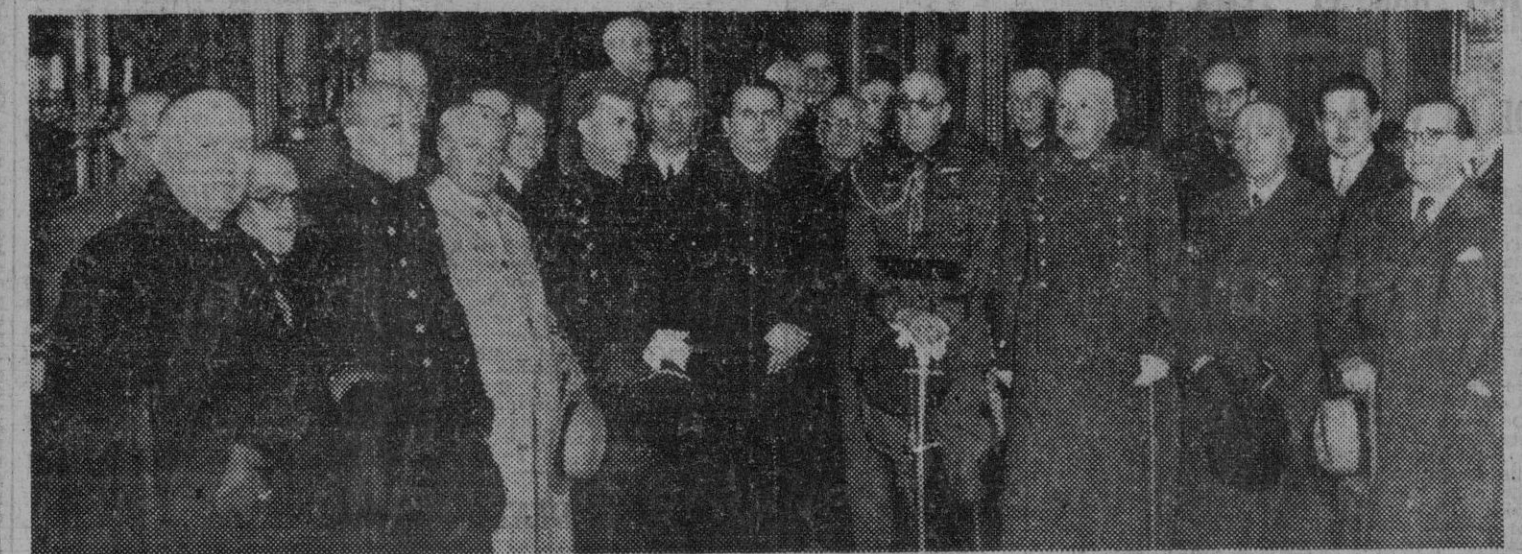
Las autoridades de Barcelona en la recepción celebrada esta mañana en Capitanía con motivo de la llegada del nuevo Capitán General

A las diez de la mañana han empezado a acudir a la Estación término de M. Z. A., numerosas autoridades, jerarquías y público para recibir al nuevo Capitán general de la Región, el laureado y heroico teniente general don José Moscardó Iturbe.