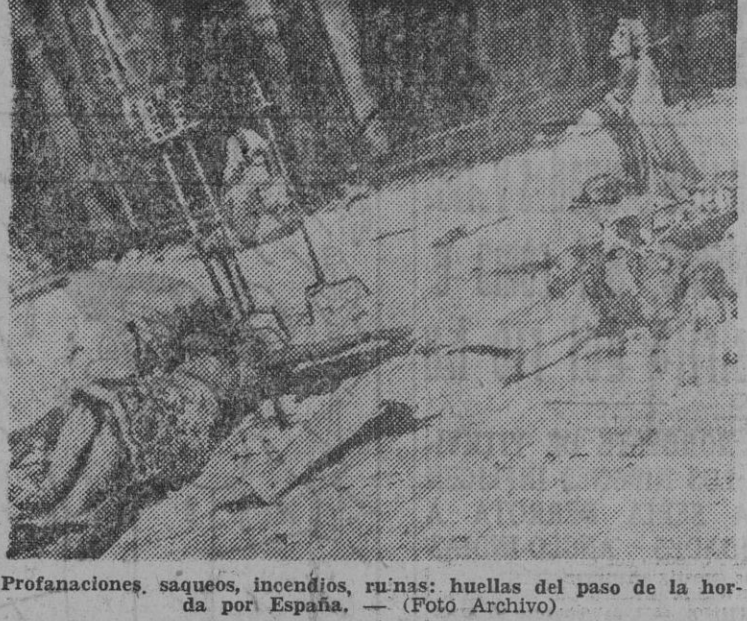
Profanaciones, saqueos, incendios, ruinas: huellas del paso de la hora por España.

VICHY, 8. (De nuestro correspondiente). — (Se ha volatilizado Brulstein) Para muchos, para casi todos, no debe haber duda alguna. Para la Policía francesa dice mucho. Brulstein, de quien ya en otra ocasión hemos hablado, es el gran