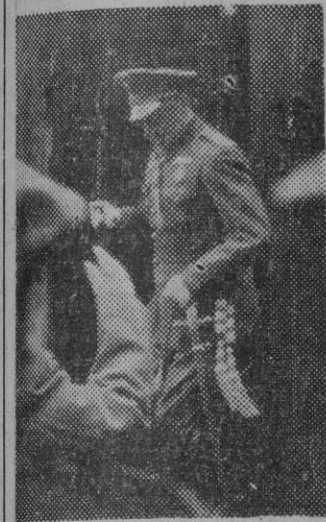
El general Moscardó descendiendo del tren

Viene a nosotros el teniente general Moscardó, aureolado por un brillante historial militar que le hace acreedor a la gratitud y adhesión de todos los españoles. Barcelona y las restantes provincias encomendadas a su mando interpretan la presencia del heroico soldado en esta porción de