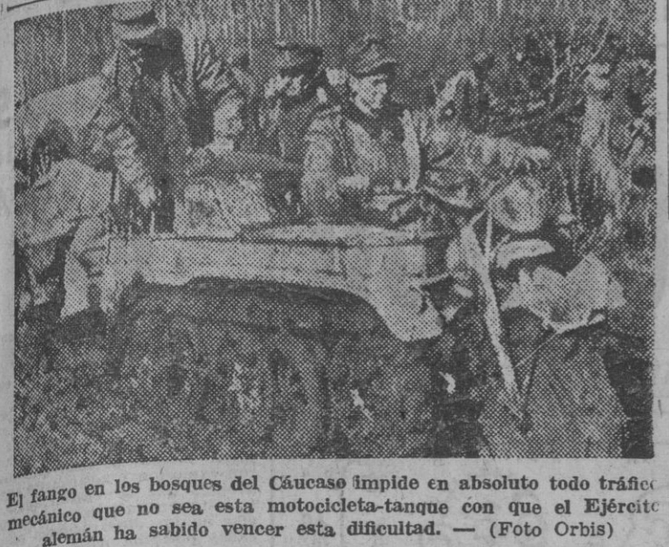
El fango en los bosques del Cáucaso impide en absoluto todo tráfico mecánico que no sea esta motocicleta-tanque con que el Ejército alemán ha sabido vencer esta dificultad.