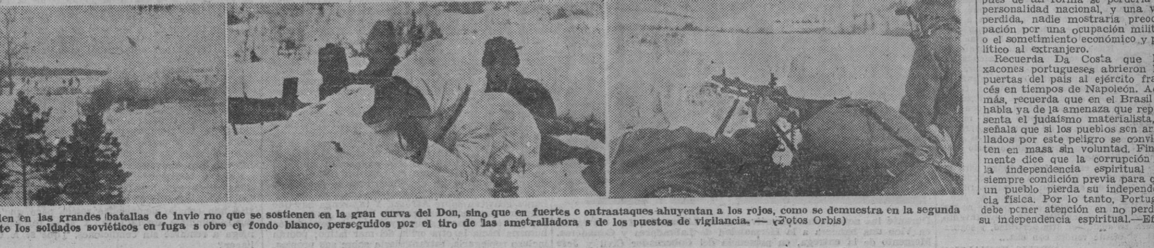
Los alemanes no sólo se defienden en las grandes batallas de invierno que se sostienen en la gran curva del Don, sino que en fuertes contraataques ahuyentan a los rojos, como se demuestra en la segunda foto, en la que se ven claramente los soldados soviéticos en fuga sobre el fondo blanco, perseguidos por el tiro de las ametralladoras de los puestos de vigilancia.