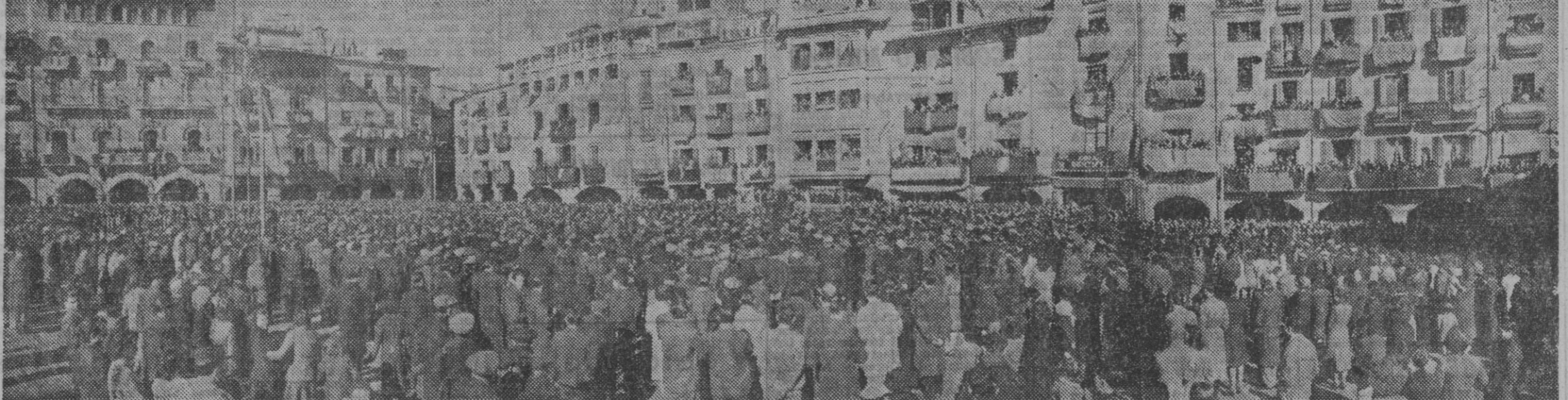
Presididos por el Gobernador Civil y Jefe Provincial del Movimiento, camarada Correa, Vich ha celebrado, con diversos y brillantes actos el IV aniversario de su Liberación por los Ejércitos del Caudillo. Nuestra fotografía muestra la plaza de la ciudad, llena por la multitud, durante uno de los actos conmemorativos.