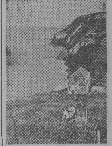
La Rusia soviética está llena de lugares tan pintorescos como este que nos presenta esta fotografía