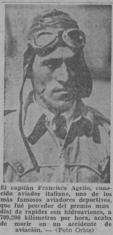
El capitán Francisco Agello, conocido aviador italiano, uno de los más famosos aviadores deportivos...