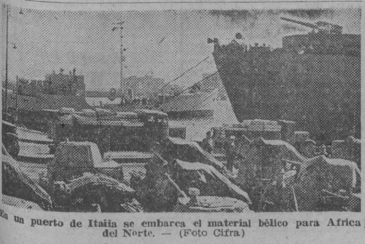
En un puerto de Italia se embarca el material bélico para África del Norte.