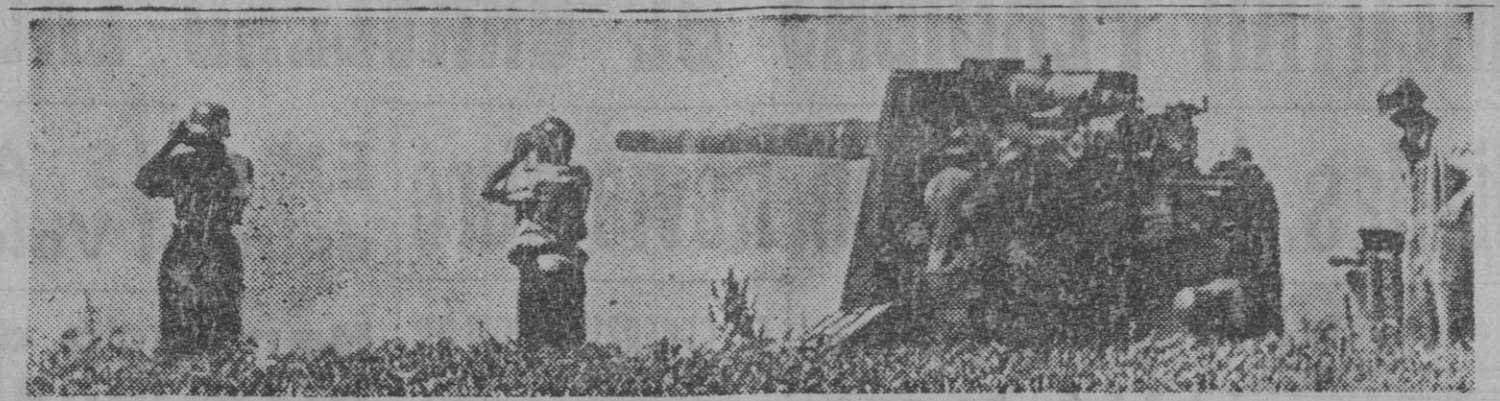
La artillería alemana ha prestado extraordinarios servicios en la conquista de Stalingrado. He aquí un cañón anti-aéreo, empleado en fuego de destrucción contra barricadas y tanques soviéticos.