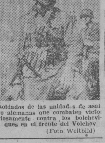
Soldados de la unidad 4 de asalto alemán que combaten victoriosamente contra los bolcheviques en el frente del Volchov.