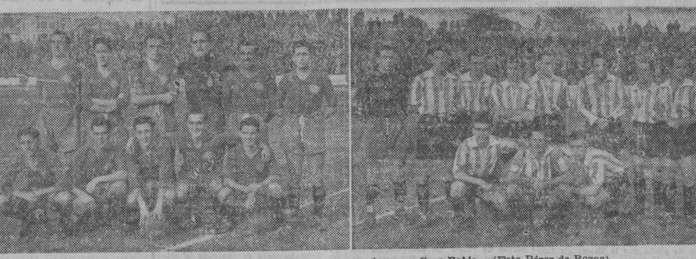
Los equipos del Español y D. Coruña que ayer empataron en Casa Rabia.

E n la jornada de ayer el Español hizo quedar mal a todos cuantos lo dábamos por favorito. Un partido malo hicieron los chicos de Casa Rabia y esa fué la causa de dejar escapar un punto de su propio terreno. Y menos mal que llegó el empate, cosa que se tenía muy problemática viendo el escaso rendimiento que daba el equipo en cuanto a profundidad. Un bache en el camino, que cualquier partido malo lo da cualquier equipo, y a empujarse para no bajar a la zona peligrosa de la promoción, cosa que no esperamos del equipo de Calcedo.