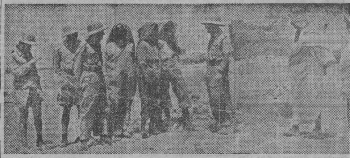
Un grupo de soldados del Cuerpo expedicionario alemán en el Norte de África conversando amigablemente con varios indígenas de las cercanías de Túnez