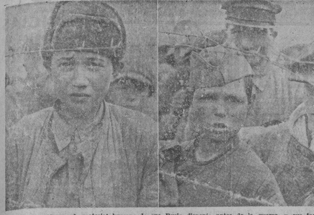
Las enormes reservas de material humano de que Rusia dispone antes de la guerra, y que tanto ponderaba la propaganda soviética, no han bastado para suplir las grandes cantidades de bajas causadas en sus filas por las alemanes. He aquí dos niños de los muchos que los comunistas obligaron a alistarse para completar sus cuadros militares.