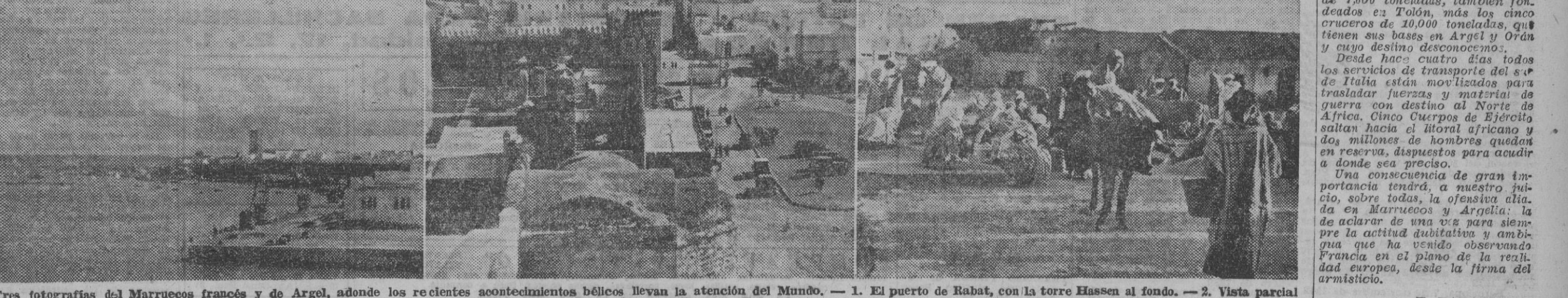
Tres fotografías del Marruecos francés y de Argel, adonde los recientes acontecimientos bélicos llevan la atención del Mundo. — 1. El puerto de Rabat, con la torre Hassan al fondo. — 2. Vista parcial de Rabat. — 3. Un poblado argelino. — (Fotos Orbis)