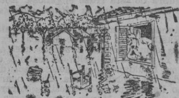
Ah, menos mal, no se trata de una avería en la cafetería del baño!