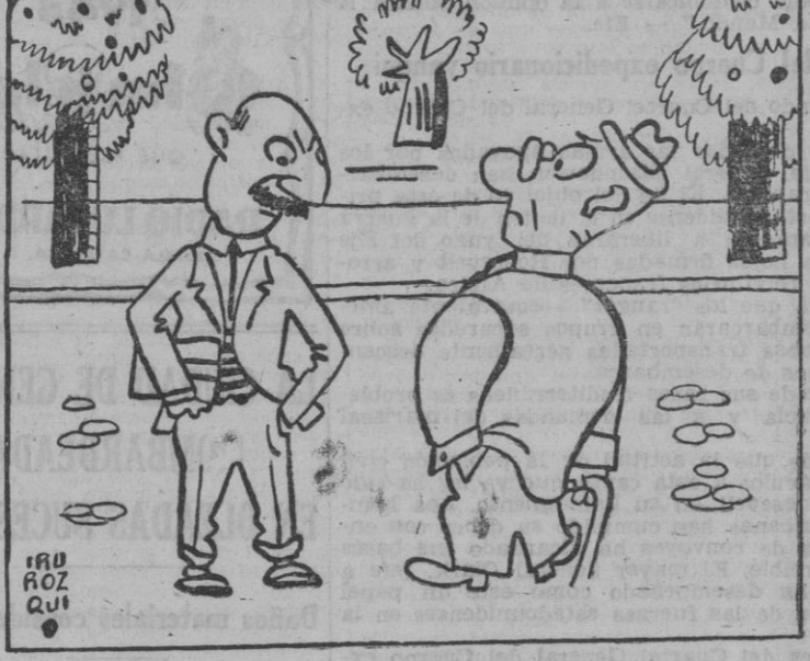
Es muy elástico opinar en ese frente. Verdaderamente es un frente de tira y afloja.