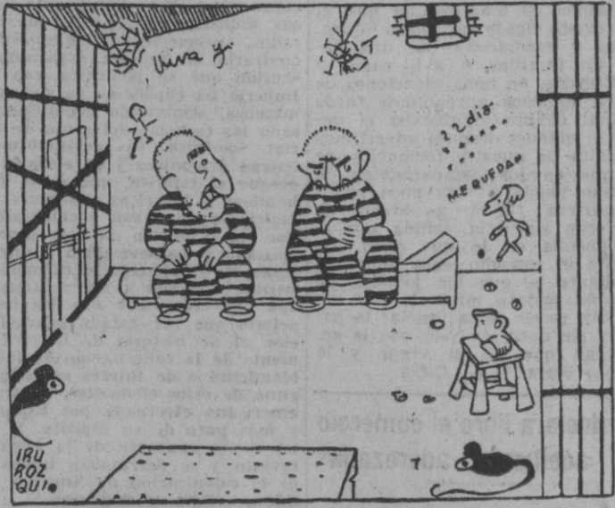
— En Madrid, 35 a la sombra. ¡Debe de ser irresistible! — ¡Bah! Aquí estamos muchos más y no nos quejamos.