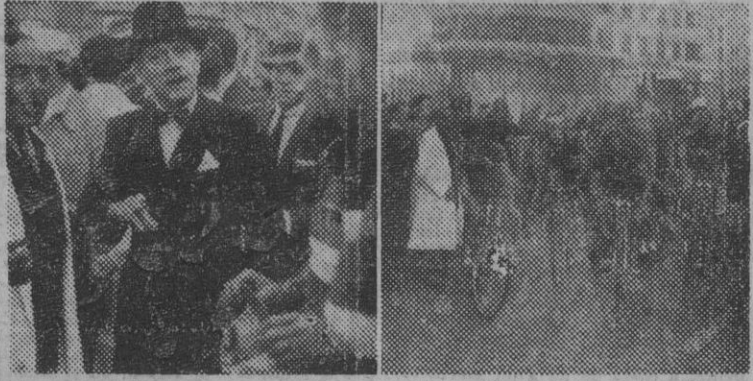
Dos momentos de la iniciación de la IV Vuelta Ciclista a España; el embajador de Francia, M. Pletri, conversa con los corredores de su país; la salida de los participantes en Madrid, para la primera etapa