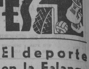
El deporte en la Falange