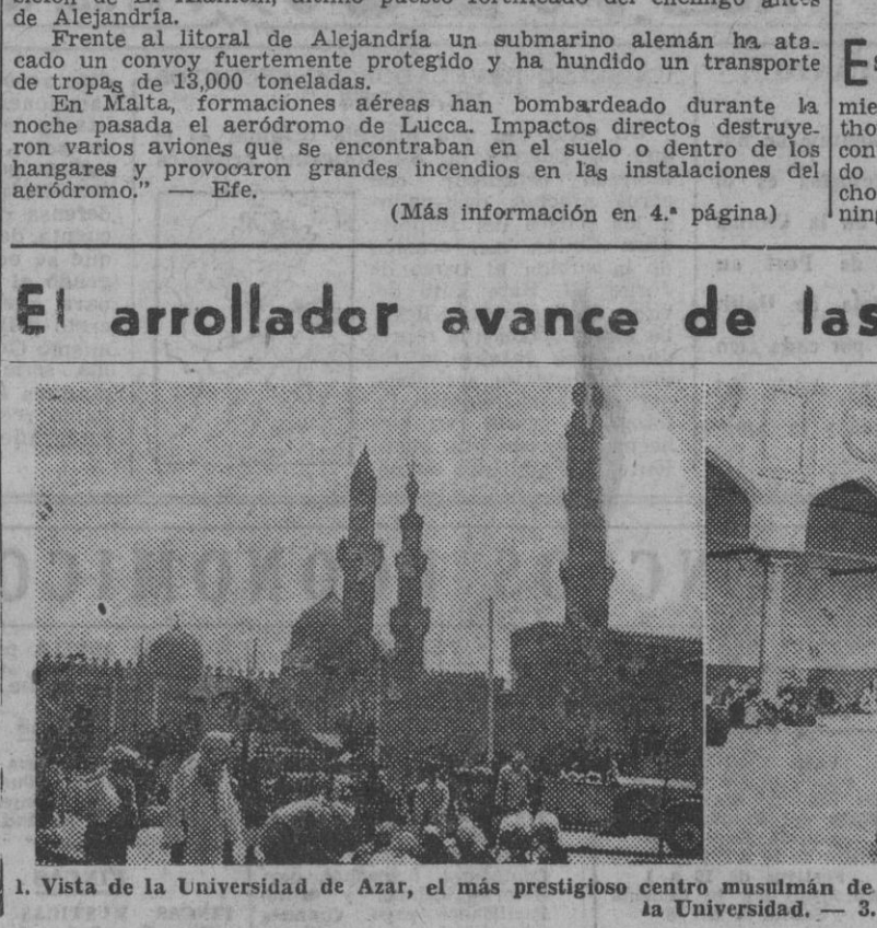
1. Vista de la Universidad de Azar, el más prestigioso centro musulmán de cultura del Mundo, donde se impulsa el resurgir de los pueblos mahometanos. — 2. Patio interior de la Universidad. — 3. Paisaje característico de Egipto.