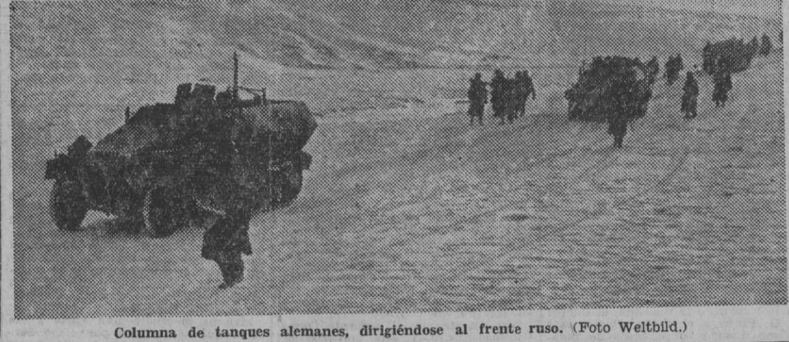
Columna de tanques alemanes, dirigiéndose al frente ruso.