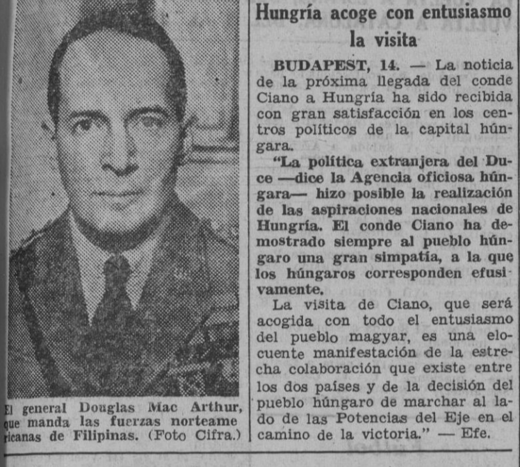
Figuras de actualidad. El general Douglas Mac Arthur, jefe de las fuerzas norteamericanas de Filipinas.

Mañana llegará a Hungría. BUDAPEST, 14. — Oficialmente se anuncia que el ministro de Negocios Extranjeros de Italia, conde Ciano, llegará a Hungría el jueves, día 15 del actual, para realizar una visita que durará varios días, por invitación del regente de Hungría, almirante Horty, y del Gobierno húngaro. — Efe.