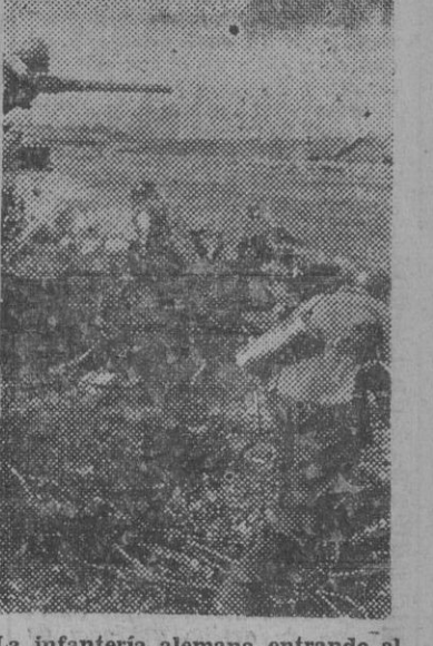
La infantería alemana entrando al asalto de unas posiciones enemigas