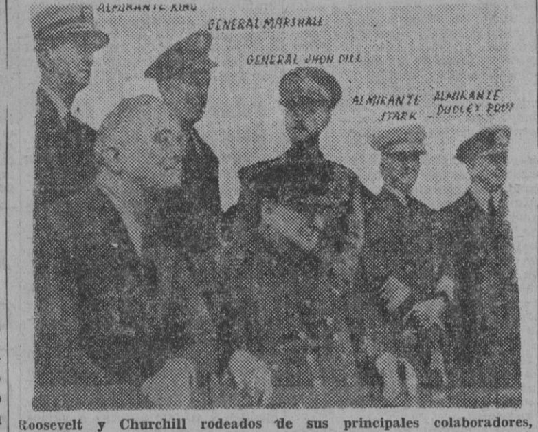
Roosevelt y Churchill rodeados de sus principales colaboradores, en la entrevista celebrada en el "Prince of Wales"