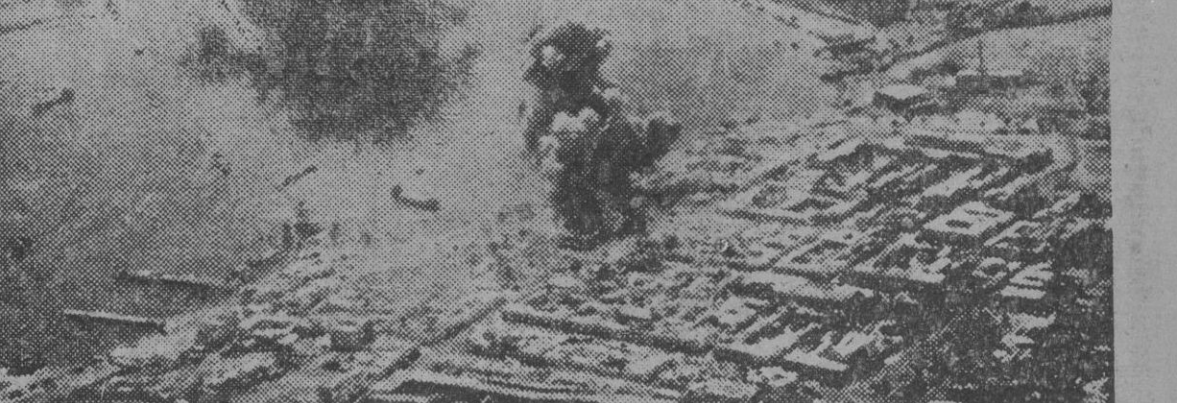
Tobruk es el objetivo constante de la aviación alemana. Grandes formaciones de aviones bombardean sistemáticamente el puerto y las concentraciones de tropas y material. La foto muestra una vista del puerto con parte de sus instalaciones ardiendo después de un "raid" de la aviación germana.