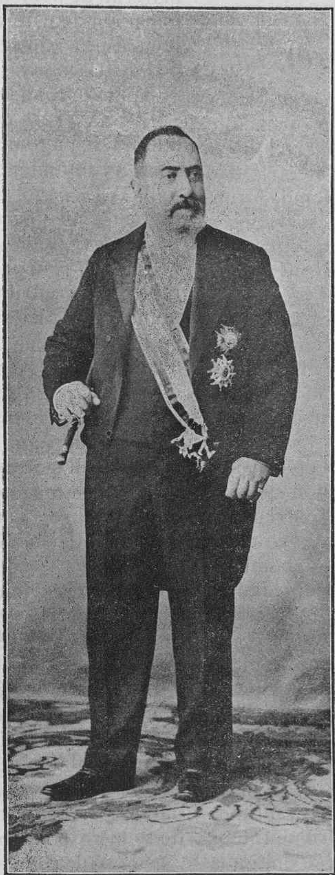
Alcalde de Salamanca y profesor de la Facultad de Medicina.

El Sr. Díez á vuelta á la Alcaldía, porque antes que político es salmantino, y aunque no han desaparecido los motivos que le obligaron á presentar la