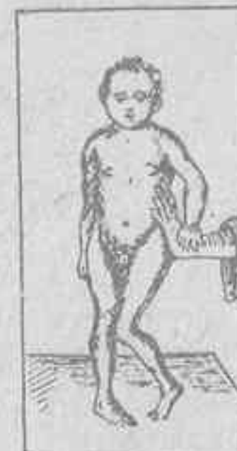
ENFERMEDAD DE LITTE