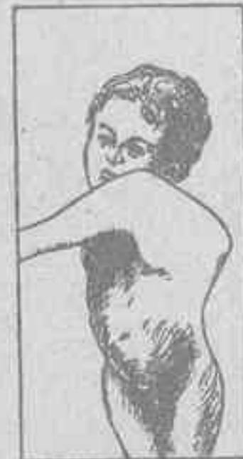
MAL DE POTT con GIBOSIDAD