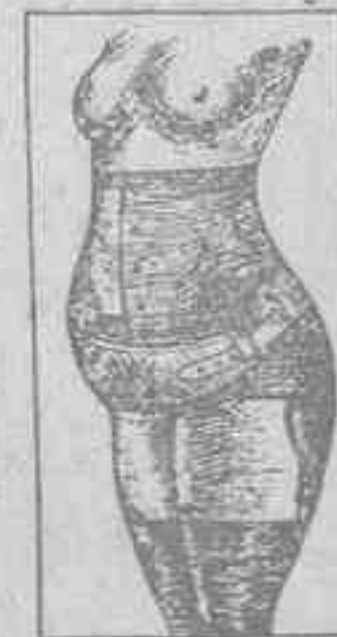
CEÑIDOR DE PRECISION