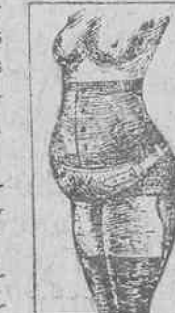
CEÑIDOR de PRECISION