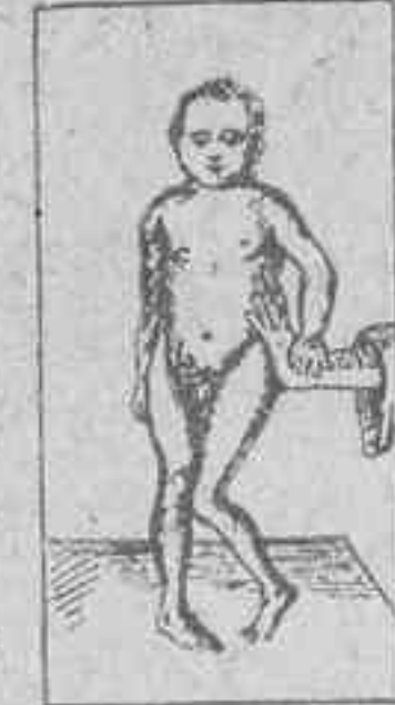
ENFERMEDAD de LITTE