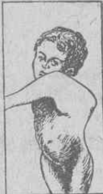
MAL DE POTT con GIBOSIDAD