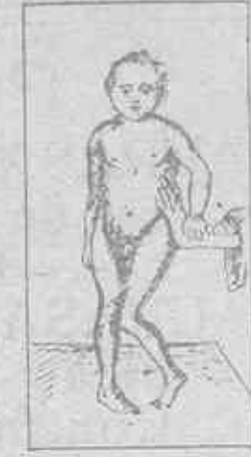
ENFERMEDAD DE LITTLE