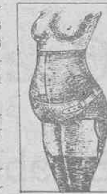
CEÑIDOR DE PRECISION