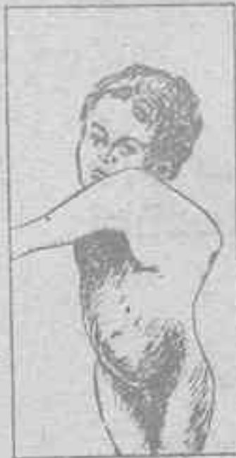
MAL DE POTT o GIBROSIDAD