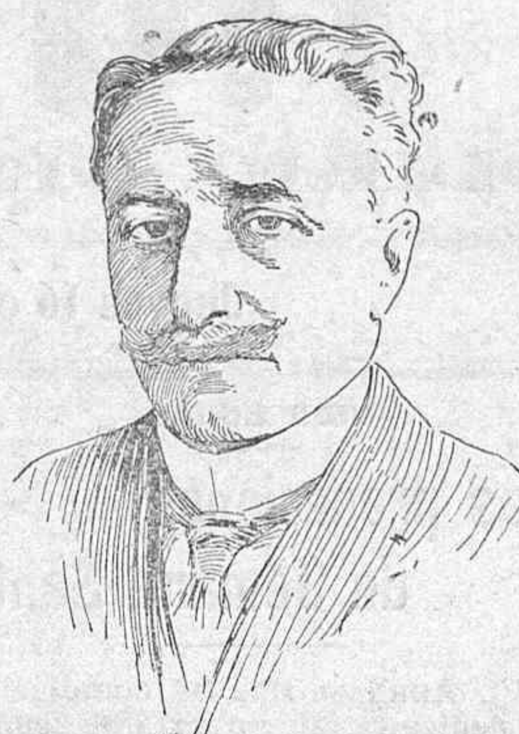
1.º Mr. Poincaré.—2.º Mr. Ribot.—3.º Mr. Deschanel.

Mañana, día 17, en el histórico palacio de Versalles, se reunirán las Cámaras francesas para elegir al sucesor de monsieur Fallières.