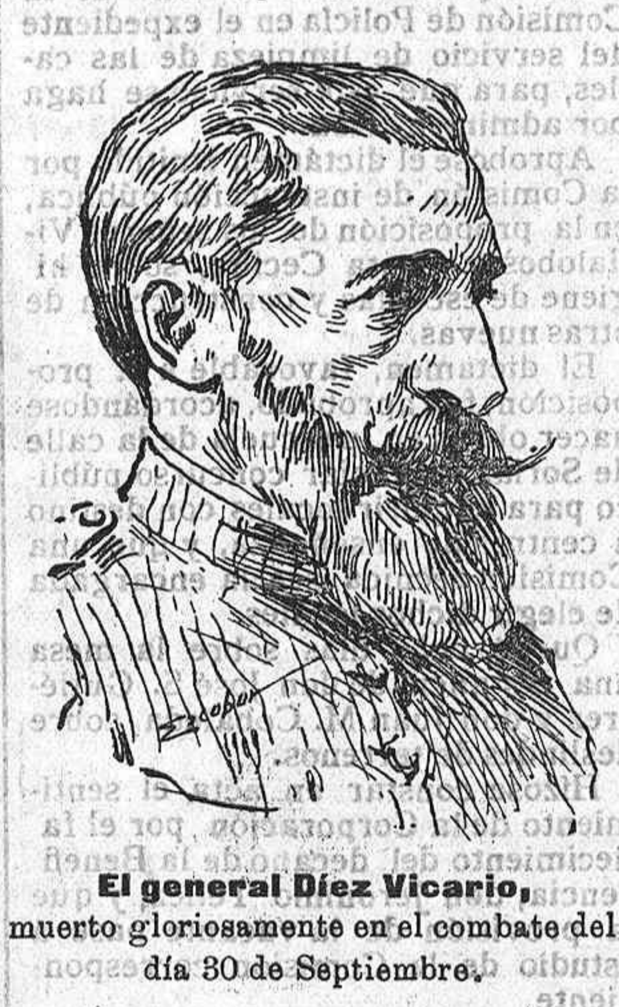
El general Diez Vicario, muerto gloriosamente en el combate del día 30 de Septiembre.