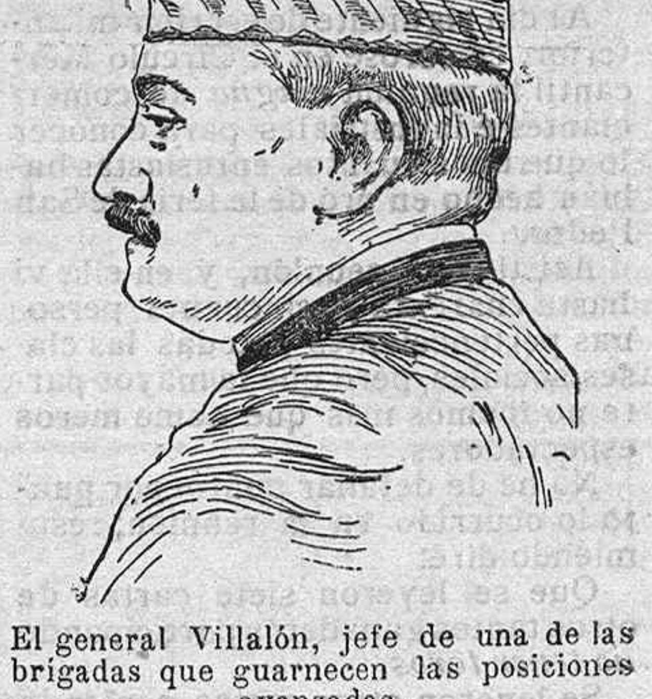
El general Villalón, jefe de una de las brigadas que guarnecen las posiciones avanzadas.