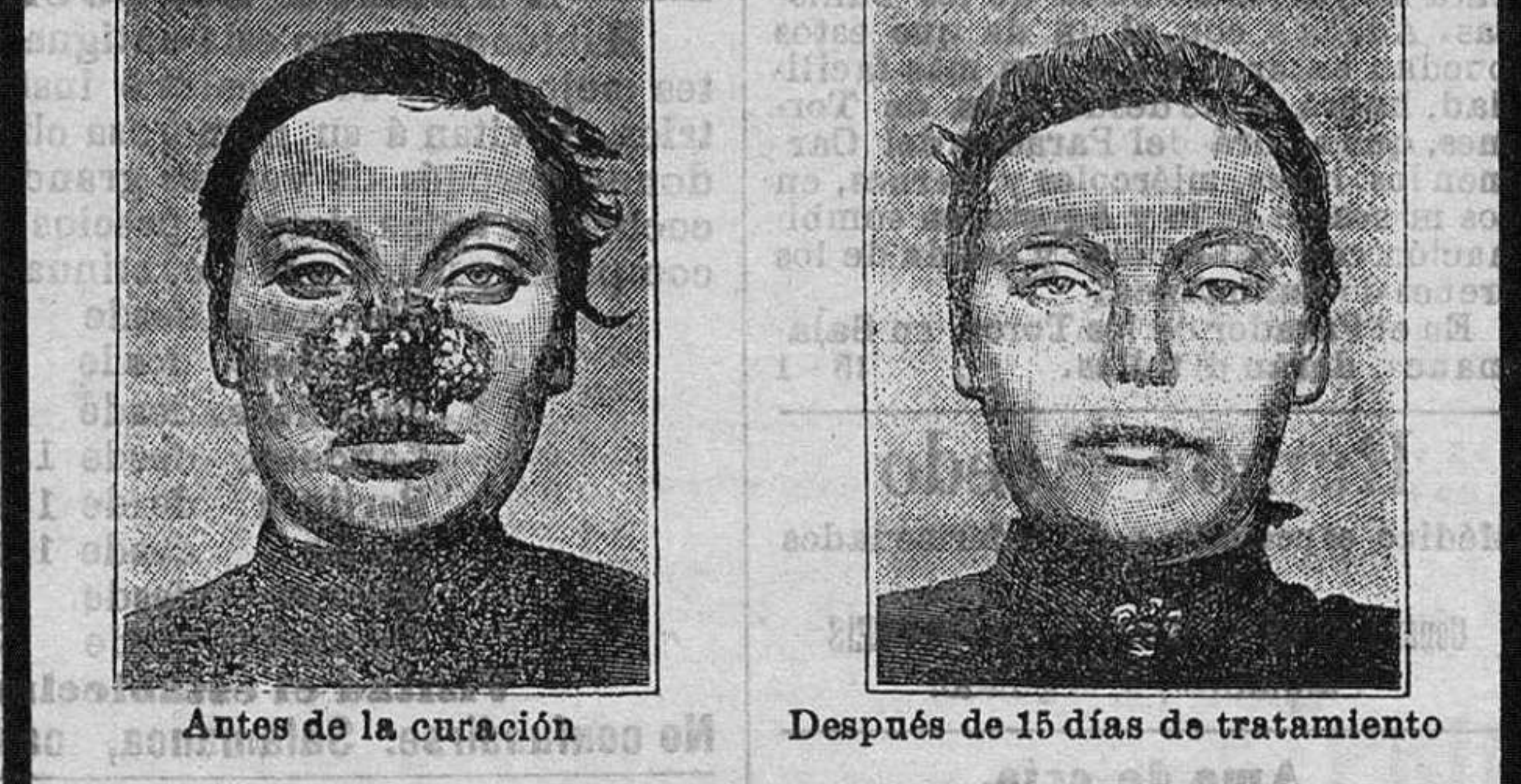
Antes de la curación Después de 15 días de tratamiento

Curación de las enfermedades de la piel y también de las llagas de las piernas. LA PIEL Males de las piernas