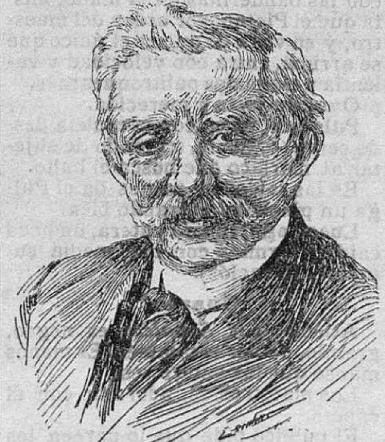
Don Federico Chueca.