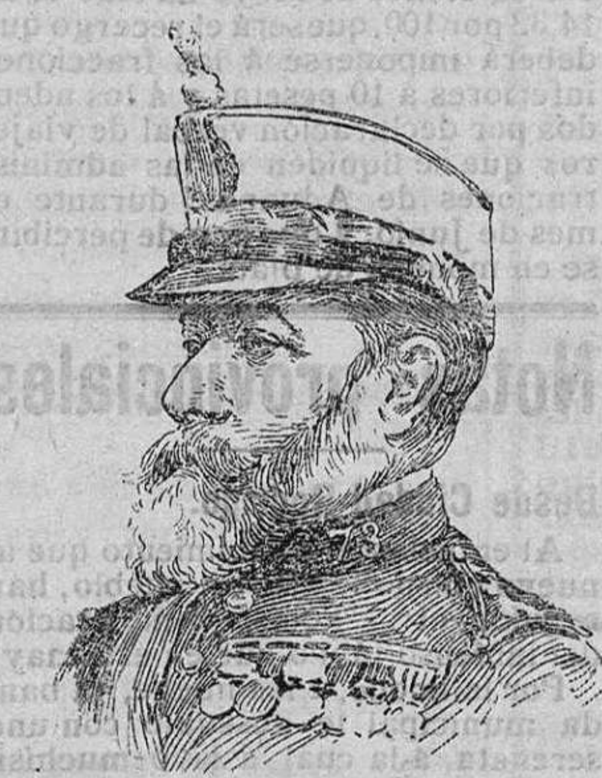
El general Marina.

No es la primera vez que se formula esa pregunta en los centros donde se reúnen políticos y periodistas. En el corto espacio de un mes, en tres distintas ocasiones ha