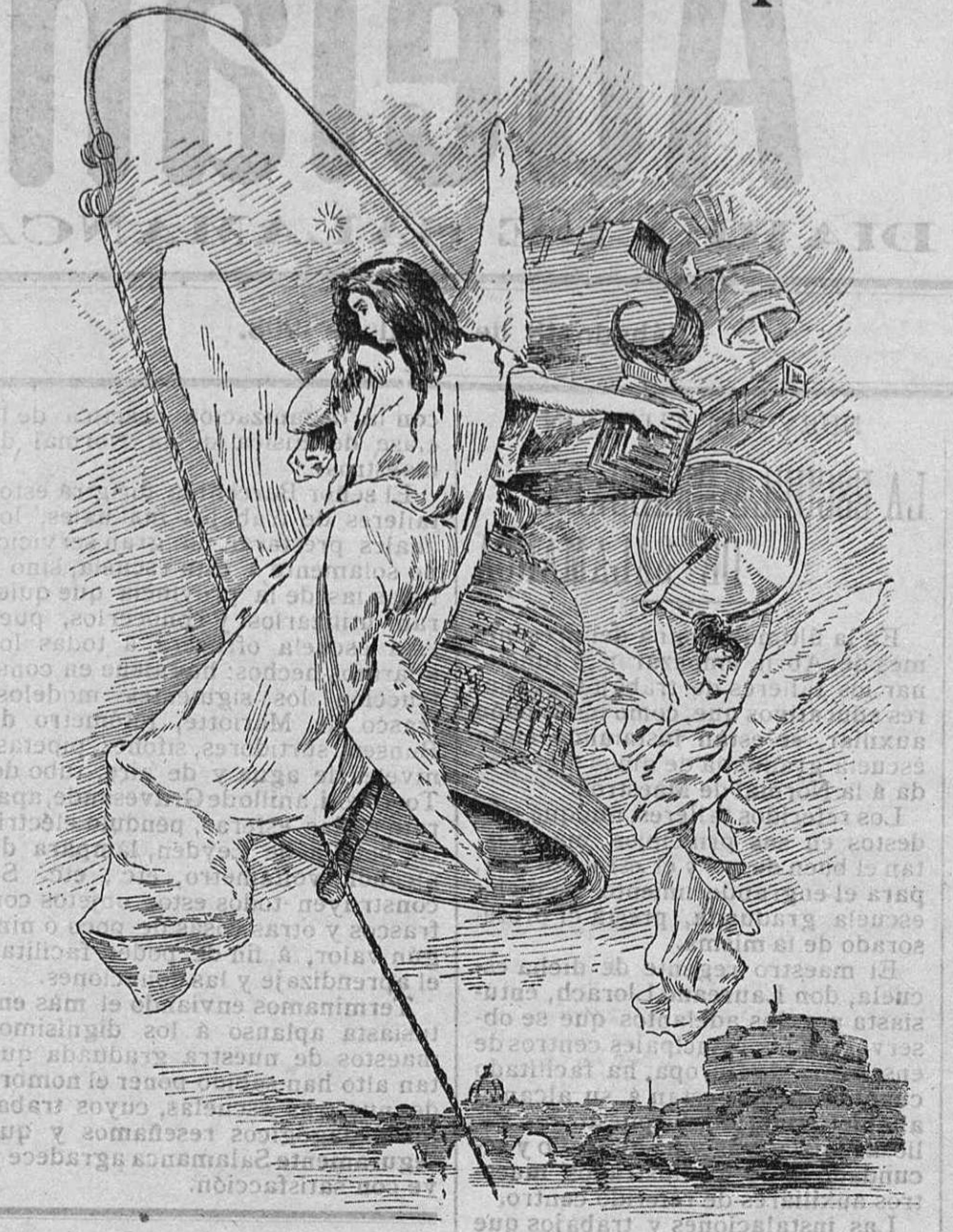
Allegoría del sábado de gloria.