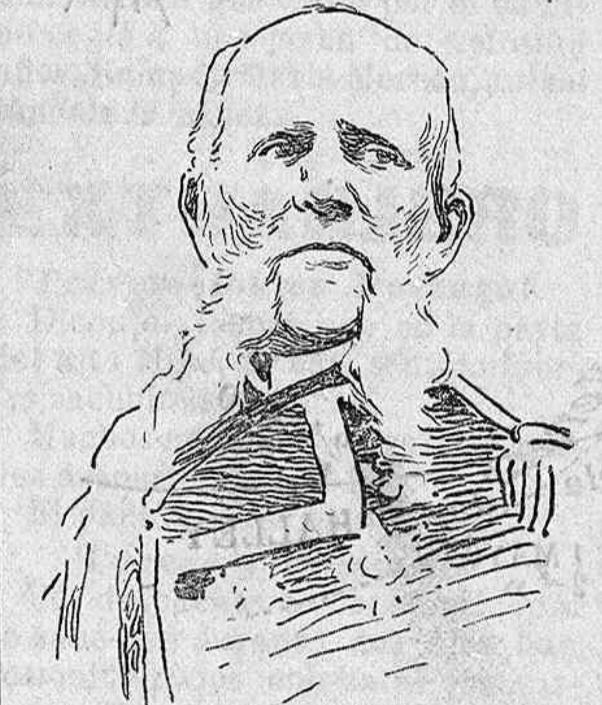
El general de la Armada, don José de la Puente, nombrado almirante de la escuadra de instrucción.

El señor Riesco pide al alcalde que coloquen los ventiladores, que han llegado para el Mercado. Y no habiendo más asuntos de qué tratar, se levantó la sesión.