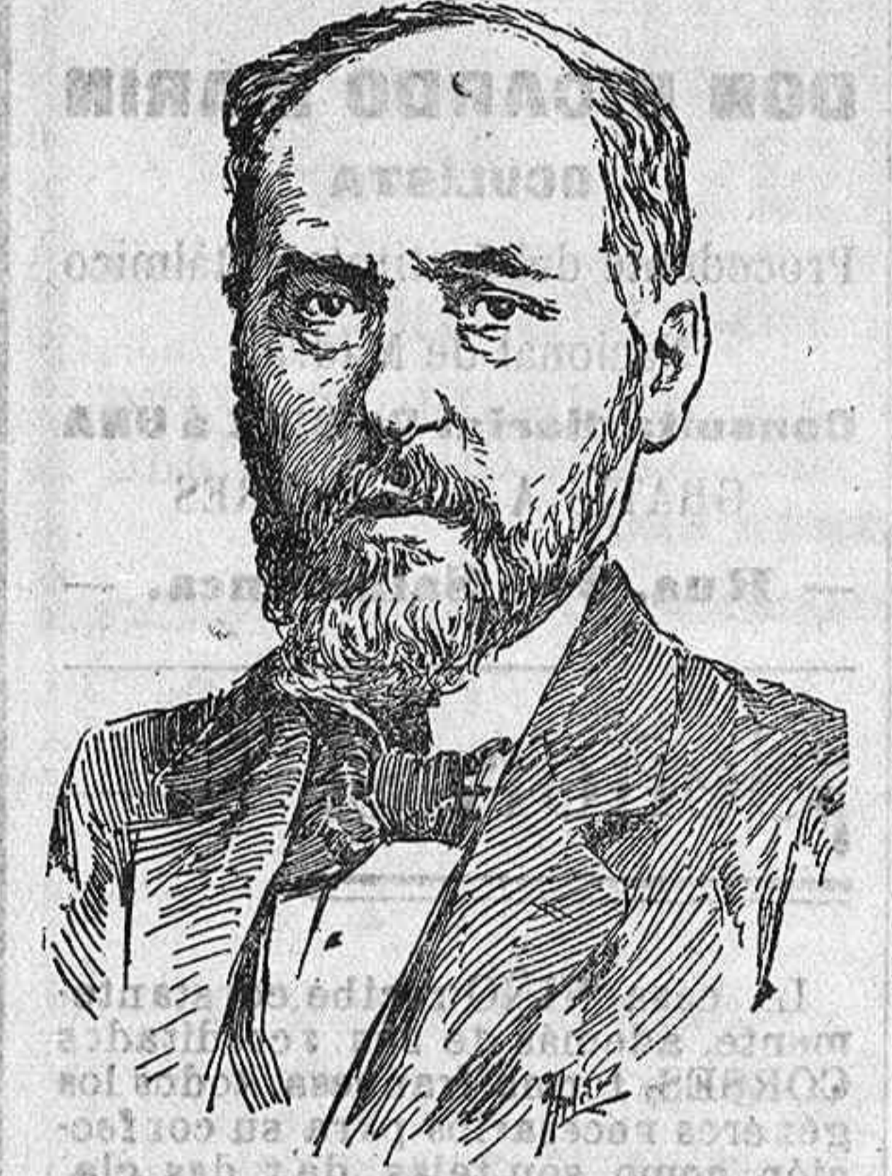
El doctor Ramón y Cajal, cuyo nombramiento de senador vitalicio está acordado, como homenaje á sus grandes méritos como hombre de ciencia.

Doctor Riesco 17. El día 1.º de Febrero, comenzaron las clases de una sección preparatoria militar, estando en argadas á ellas 5 señores oficiales del Ejército. El mismo día, dieron también principio las clases del grado de bachiller, para cuyo efecto esta Academia ha aumentado su personal con un doctor en Ciencias y un licenciado en Letras.