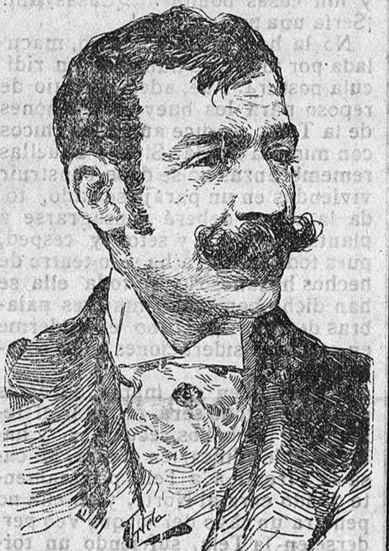
Mariano Benlliure, cuyo nombramiento de senador vitalicio será firmado en breve, como un homenaje á sus grandes triunfos artísticos.

—Ni un sólo instante debilitóse, durante los 20 asaltos, el vigor ni el arrojo de los combatientes. En los comentarios de todos los círculos aristocráticos de París hay grandes elogios para el caballeresco comportamiento del simpático teniente de la escolta real que noblemente ostenta el título de marqués de Campollano.