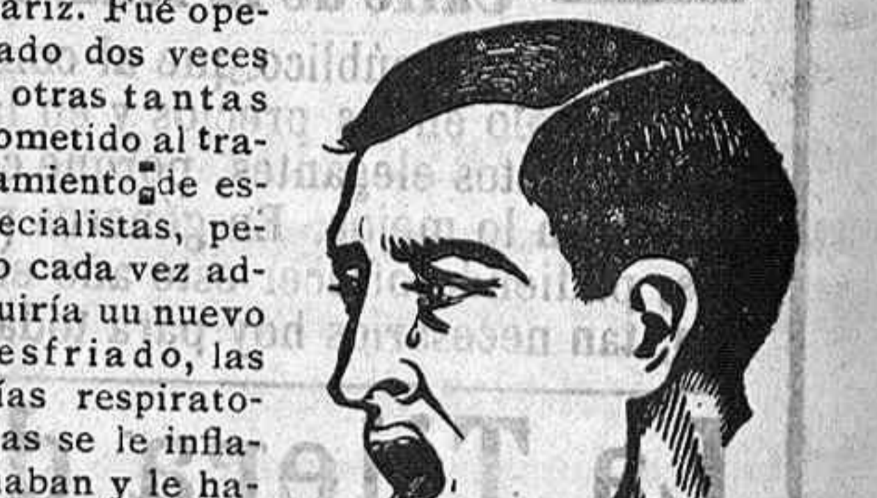
Doctor Riesco 17.

El día 1.º de Febrero, comenzaron las clases de una sección preparatoria militar, estando en argadas á ellas 5 señores oficiales del Ejército. El mismo día, dieron también principio las clases del grado de bachiller, para cuyo efecto esta Academia ha aumentado su personal con un doctor en Ciencias y un licenciado en Letras.