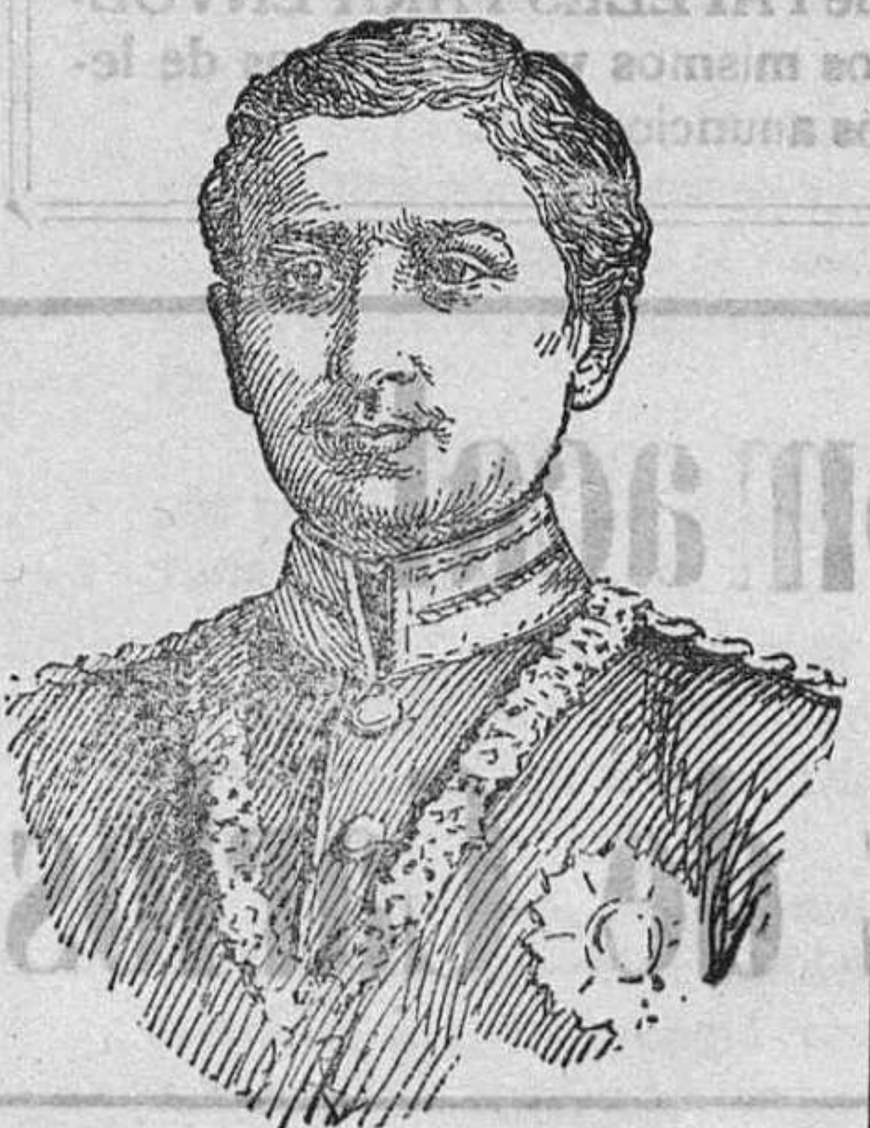
EL PRÍNCIPE EITEL FEDERICO

Esto no obstante, el folleto La crisis húngara y los Hohenzollern que ha visto la luz estos días atrás en Berlín, ha levantado gran polvareda tanto en Austria como en Alemania, y sobre todo, en los círculos