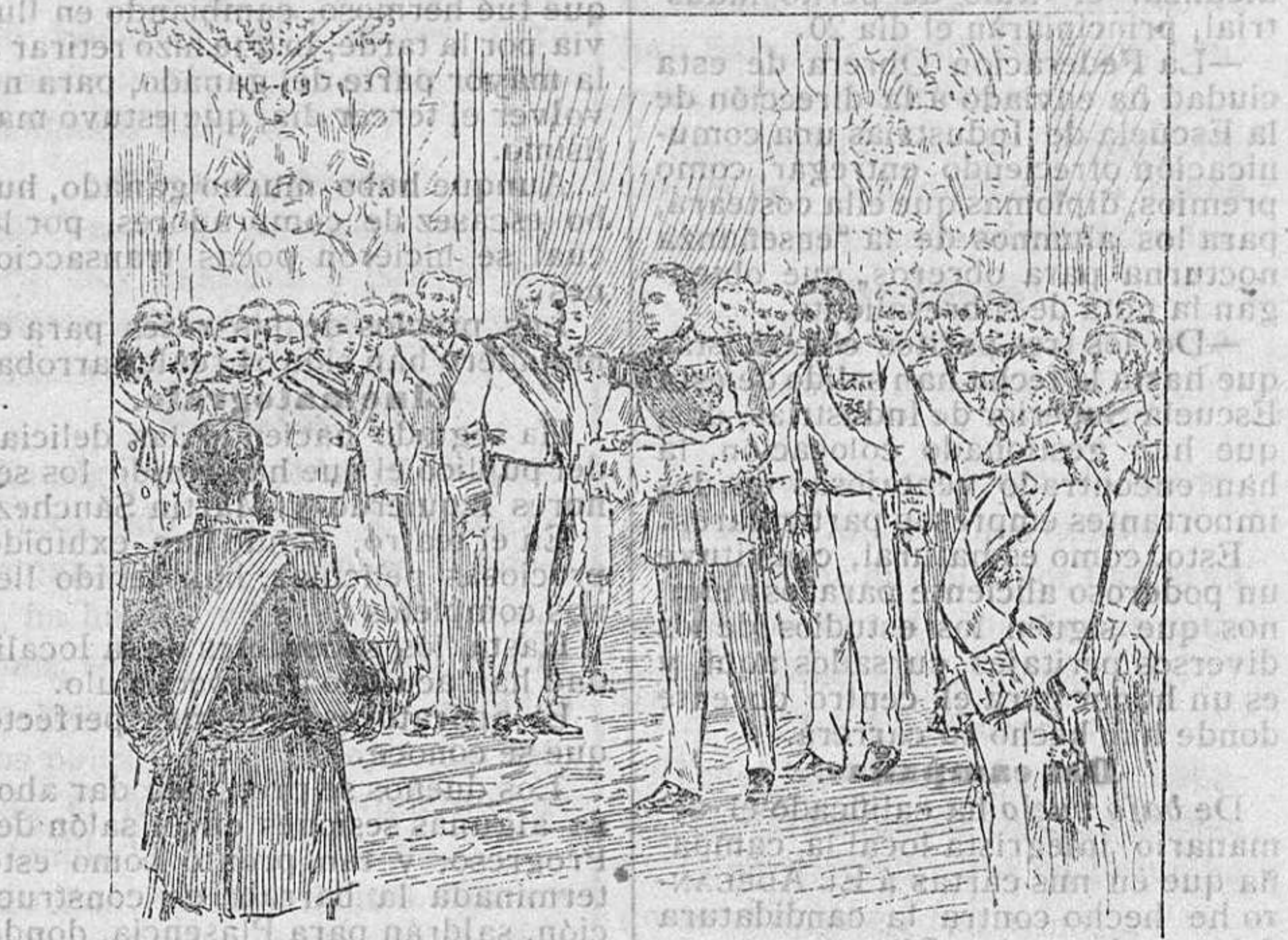
SU MAJESTAD EL REY HACIENDO LA PRESENTACION DEL RECIEN NACIDO