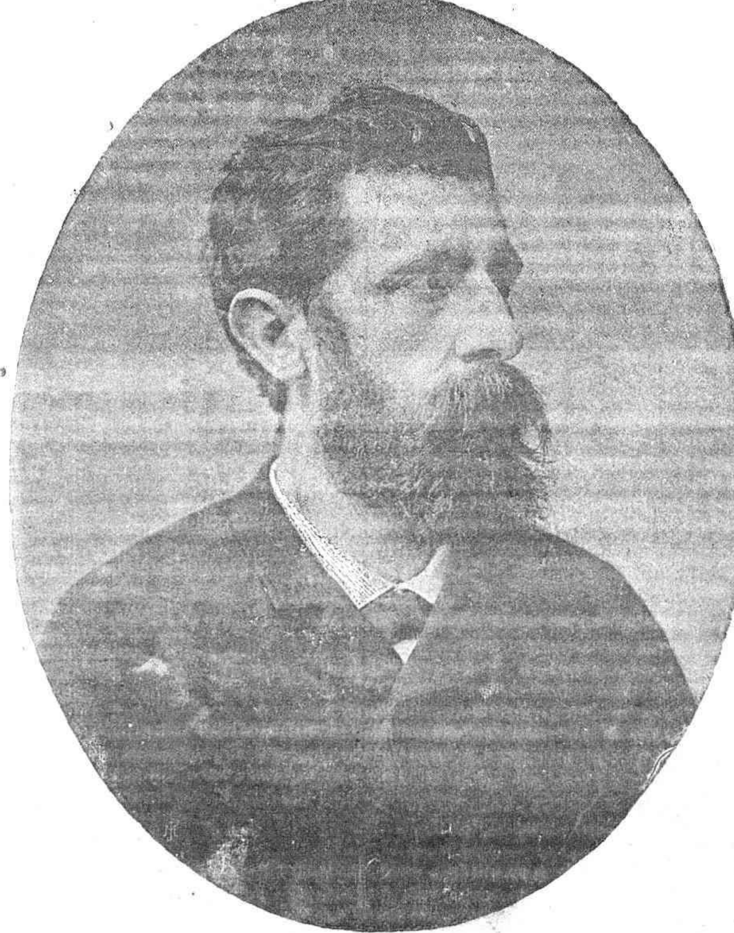
El maestro Bretón, cuando estrenó su primera obra Guzmán el Bueno .