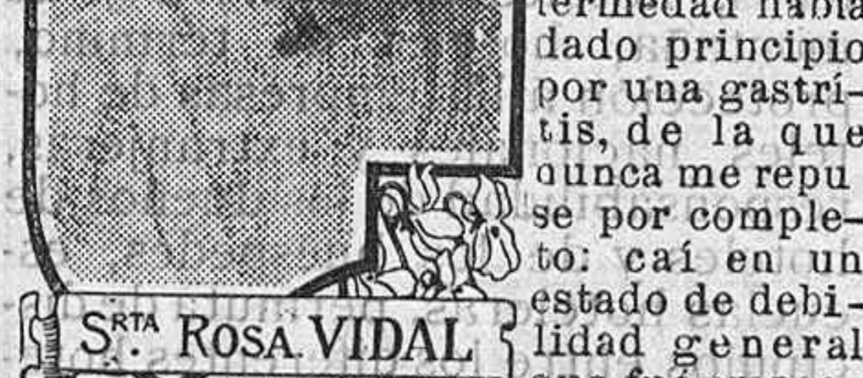
LA SEÑORITA ROSA VIDAL.

Se hallan de venta en todas las far- macias al precio de 4 pesetas la caja, 21 pesetas las seis cajas.