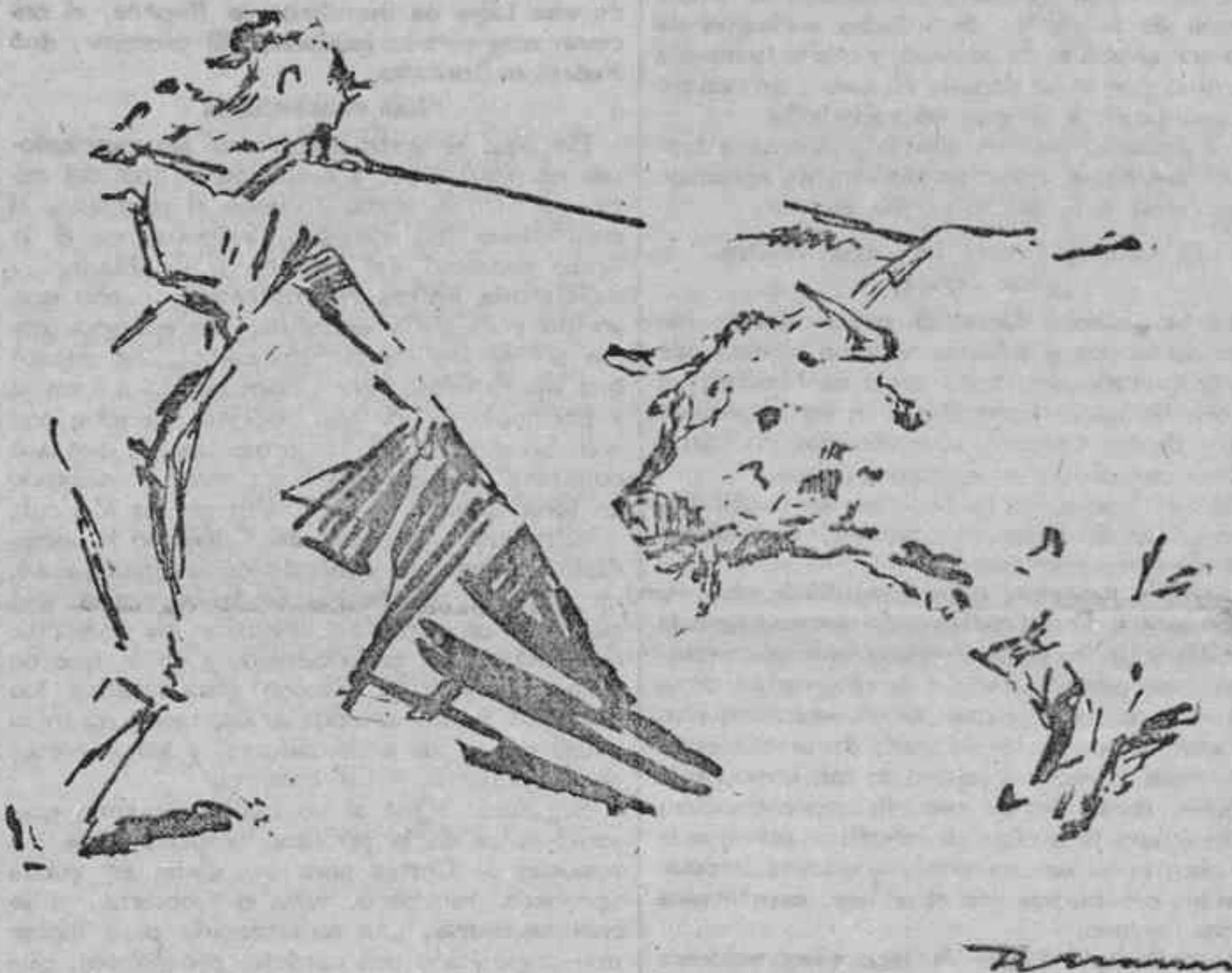
Ventoldra entrando a matar al tercer toro, fabonero, entre los tercios del 1 y el 2

Los dos matadores fueron ovacionados. La entrada, un lleno.