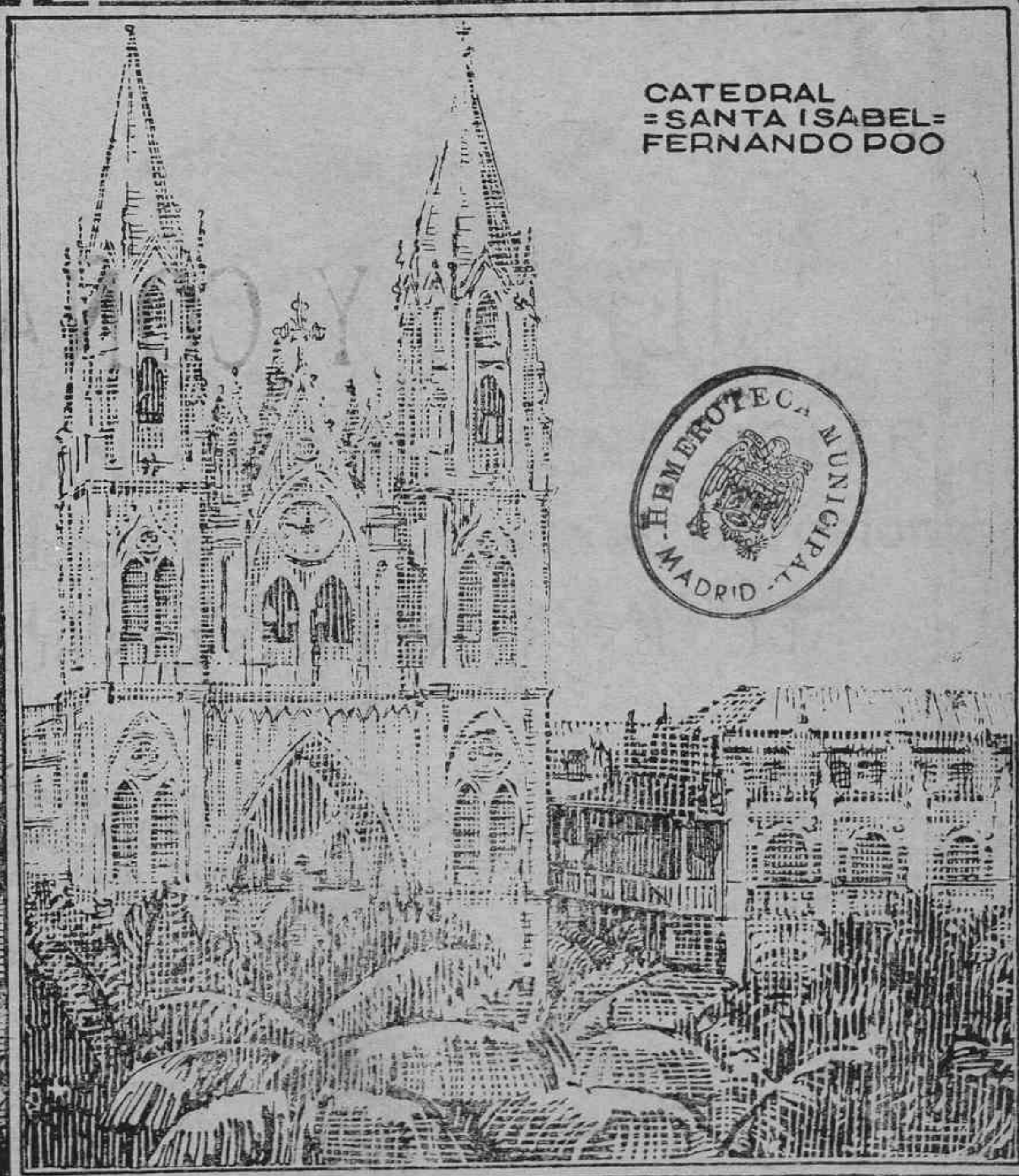
CATEDRAL = SANTA ISABEL- FERNANDO POO