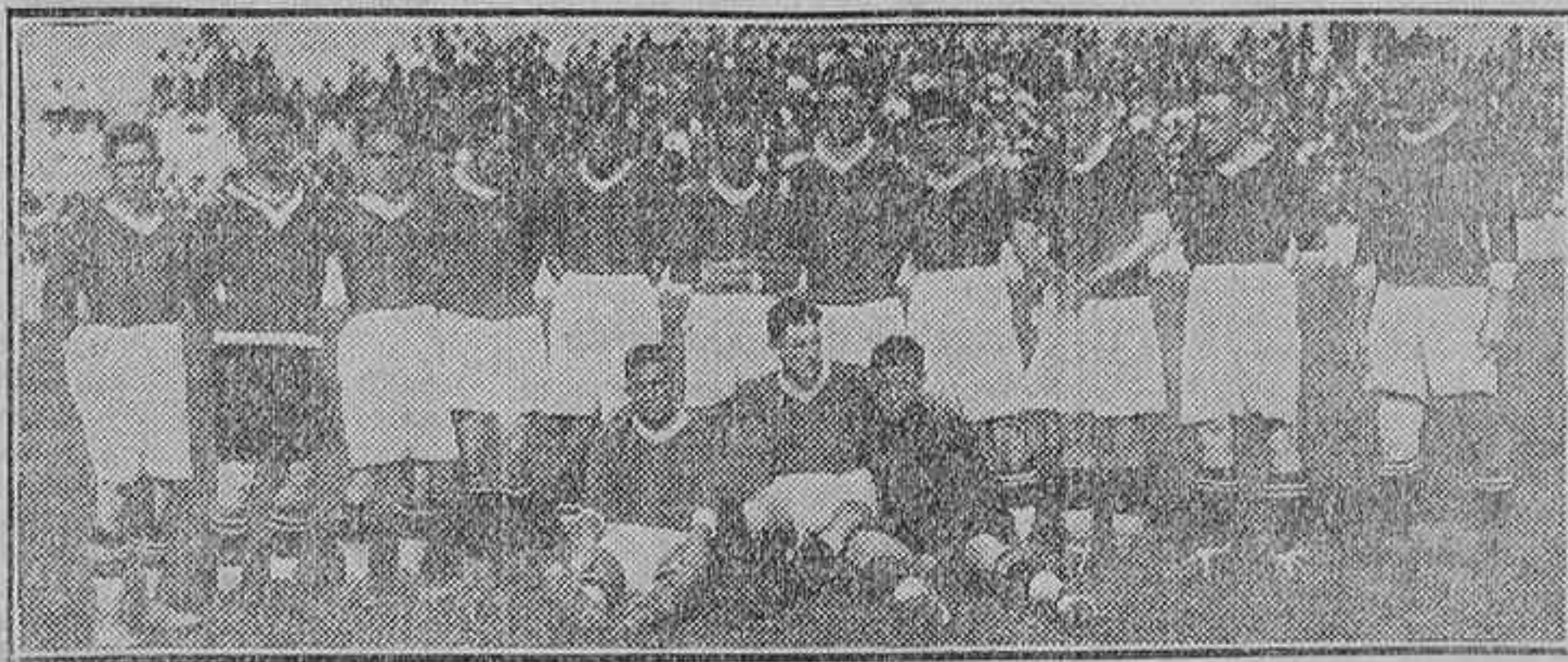
LA SELECCION VALENCIANA QUE CONTENIDIO ANTEAYER CON LA MADRILENA