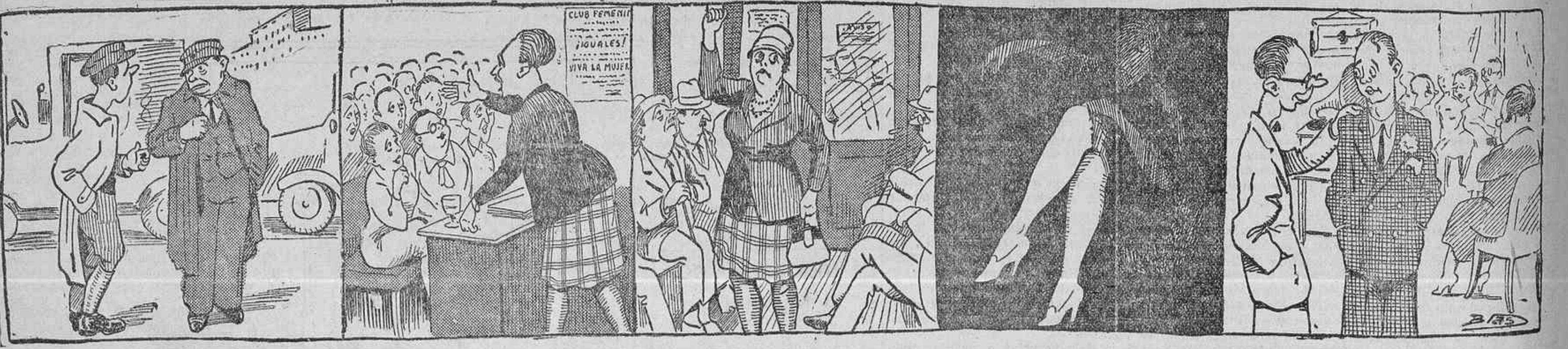
—¿Te has fijado en la afluencia de forasteros? —Chico, es que con esto del adelanto de la hora, el que más y el que menos se confunde, ¡y se nos han adelantado los kidneys! —¡Abajo ese artículo del Código que pone en manos del hombre un revólver homicida! ¿Qué es eso de hacer fuego contra una pobre mujer, precisamente en circunstancias en que es el hombre quien lo merece? —Si yo fuera un hombre y los que van sentados fueran mujeres, estoy segura de que ya me habrían ofrecido un asiento. «La bella estrella norteamericana Miss-trotrop». (Interesantísima fotografía de un periódico diario.) —¿Qué te ha parecido «La caraba», de Muñoz Seca? —¡Bestial! —¿Y la Alba? —¡Jamón! —¿Y Bonafé? —¡Mojama!