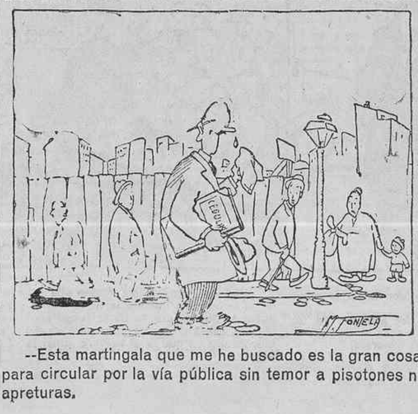
--Esta martingala que me he buscado es la gran cosa para circular por la vía pública sin temor a pisotones ni apreturas.

España-India La primera actuación de España en el famoso torneo será contra el equipo indio. El orden del sorteo da derecho a España a escoger lugar para el encuentro, y nuestra Asociación ha acordado celebrar el «match» India-España en Barcelona, los días 7, 8 y 9 de Mayo. El «match» tendrá efecto en las pistas del Real Lawn Tennis Club del Turó, que ha aceptado las condiciones ofrecidas por la Asociación para la organización del «match». Aun no se conoce la composición del equipo de la India, y en cuanto al de España servirán, en parte, para formarlos los resultados