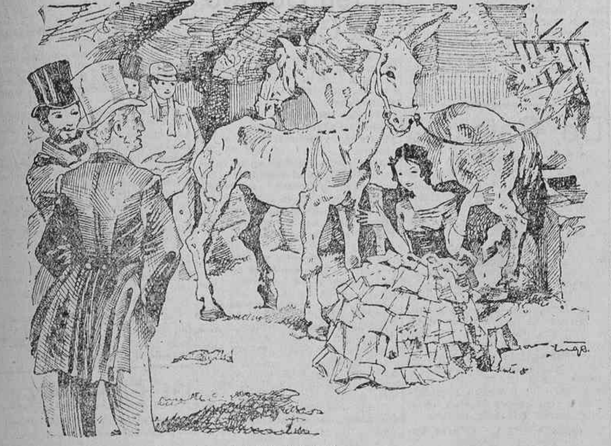
LA CARABA. (Estampa de Enrique Garcia Ormaechea.)

el real de la feria, a continuación o en medio de otras semejantes, y donde se acumulaban enseres y muebles, de suerte que resultase amplio salón, lujoso y cómodo, pues que en él se hacía la vida, recibíase a los amigos, se cantaba, se bailaba, reinando