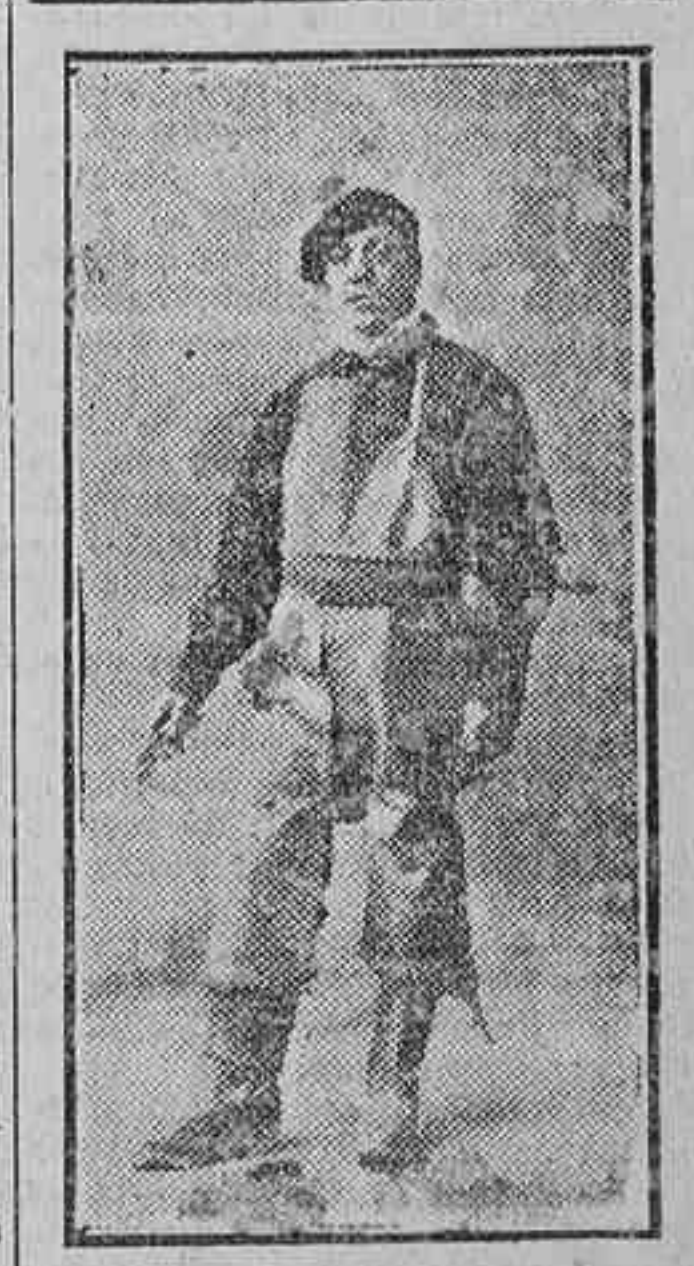
Un matarife con el uniforme que ayer vistieron por primera vez los empleados del Matadero de Madrid

Londres, 25.—Telegrafían de Oglatoma City (Estados Unidos) a los diarios dando cuenta de haber perecido veintiséis mineros a consecuencia de la inundación de una mina.