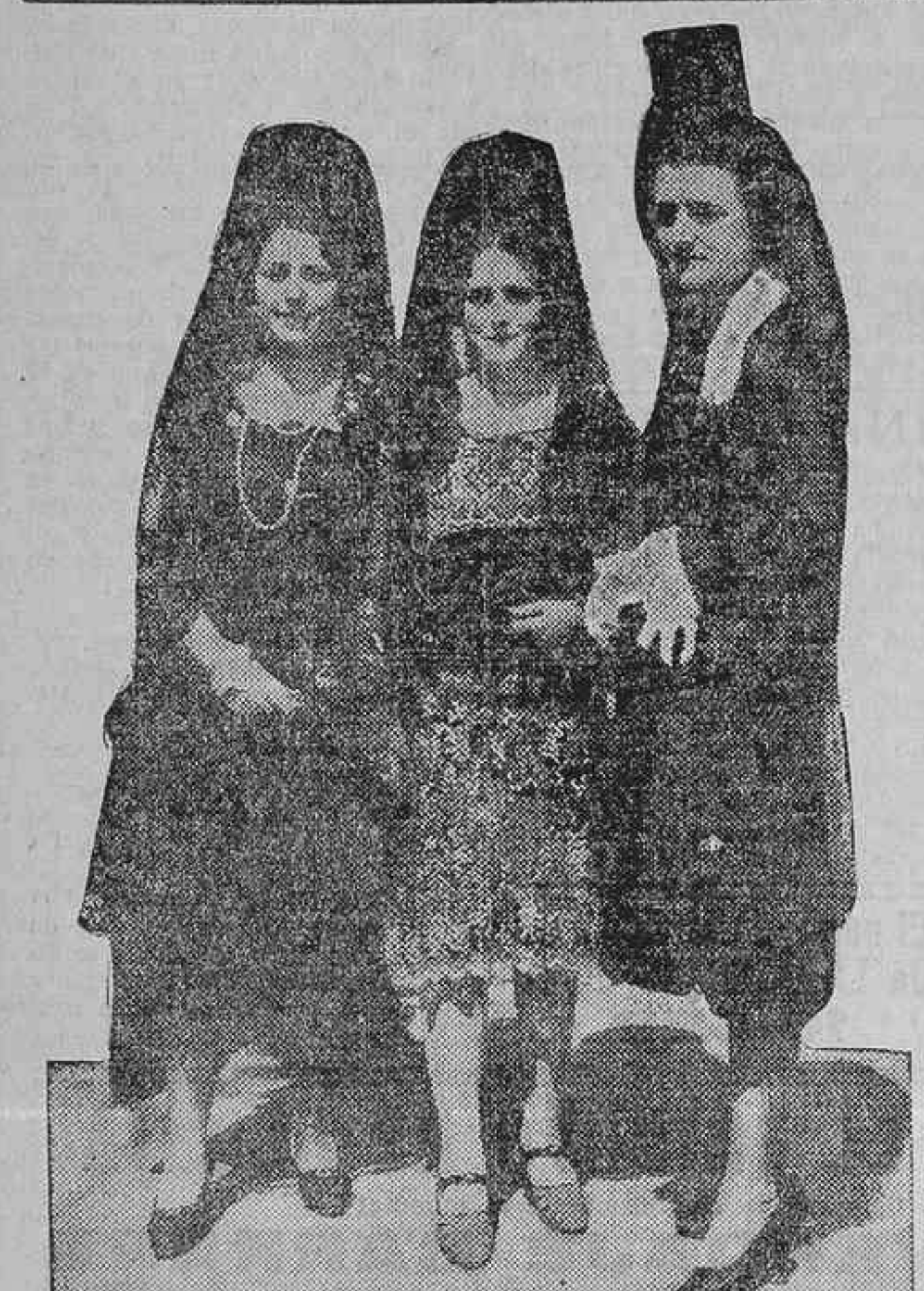
VIERNES SANTO EN MADRID.—PRESENCIANDO EL PASO DE LA PROCESION

El 15 de Abril de 1828, como ya se sabe, murió Goya en Burdeos. De no faltar todavía un año para el centenario, ahora se presentaba la ocasión única de esa conmemoración que el gran pintor merece. Este 15 de Abril es precisamente Viernes Santo, y hubiese sido un éxito de la Junta del centenario el poder organizar la tétrica Cofradía goyesca de encapuchados—las máscaras taciturnas que se escaparon para alumbrar su entierro—, después de la visita del Jueves al «monumento», el verdadero monumento a Goya, en San Antonio de la Florida,