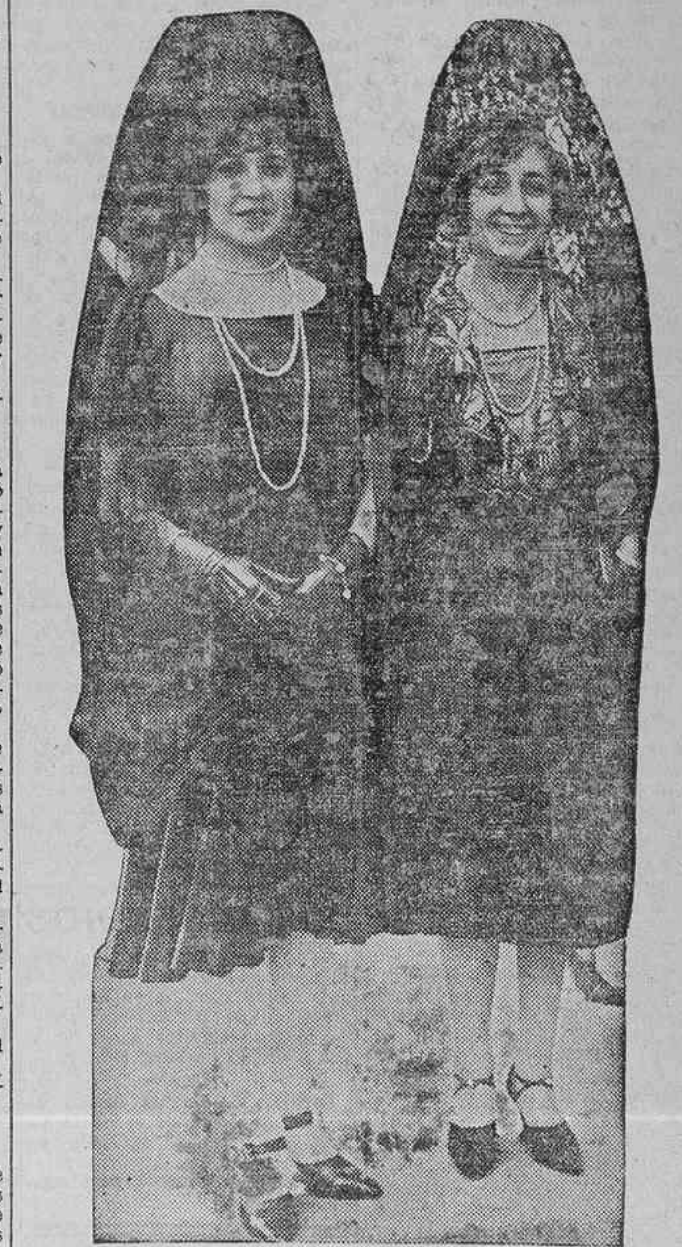
VIERNES SANTO EN MADRID.—UNA MORENA Y... OTRA MORENA