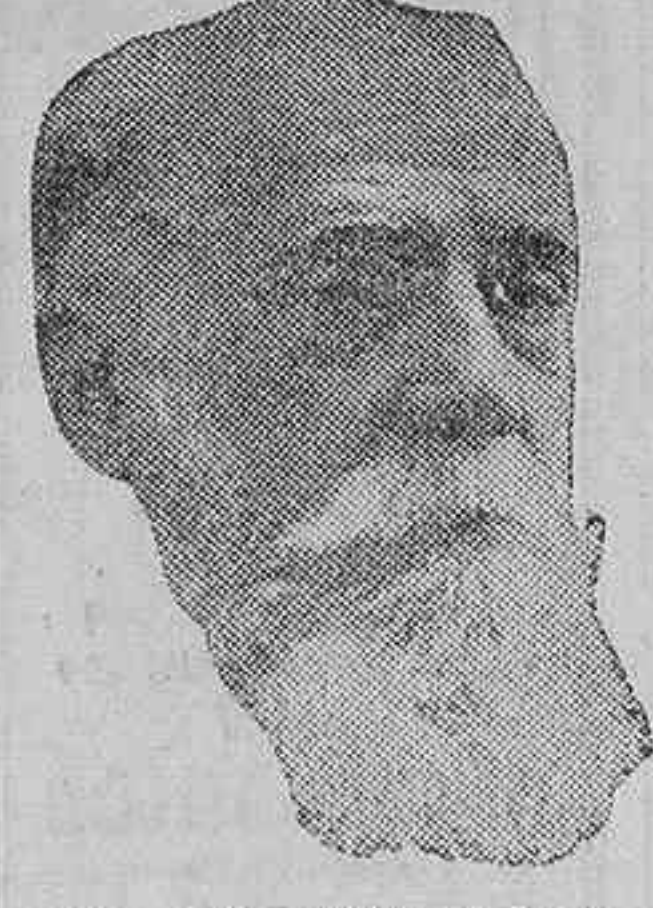
Don Rafael María de Labra

orientó en todo al pensar y en todo el vivir. Unos profesores nos enseñaron las primeras letras; otros, los rudimentos del Derecho, de la Moral, de la Física o de la Matemática. Y a todos llamamos maestros y a todos los somos de.