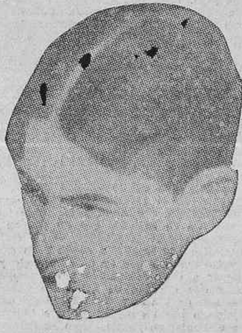
El pugil Knut Hansen, adversario de Uzcudun en el «match» celebrado anoche en Nueva York.

El casco y los motores del hidroavión se hundieron rápidamente, arrastrando a los otros tres tripulantes del aparato, a quienes se considera perdidos.