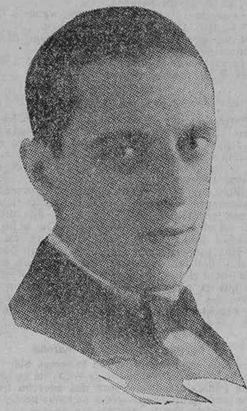
El galán cinematográfico español Alfonso Orozco

El sábado, día 15 de los corrientes, tendrá lu-