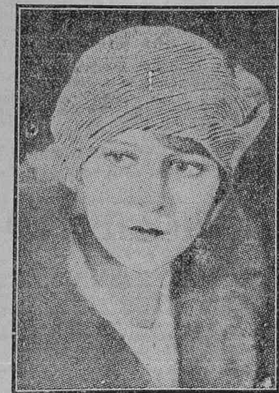
Margarita de la Motte, bellísima «estrella» de la Pro-Dis-Co, que en «El soldado desconocido» hace una asombrosa creación

El tema de la gigante pugna que ensangrentó Europa ha sido desarrollado cinematográficamente de un modo prodigioso en varias producciones, cuyos títulos recuerdan todo afeccionado al arte mudo. Imposible parecía superar y aun igualar lo hecho; mas he aquí que la famosa marca PRO-