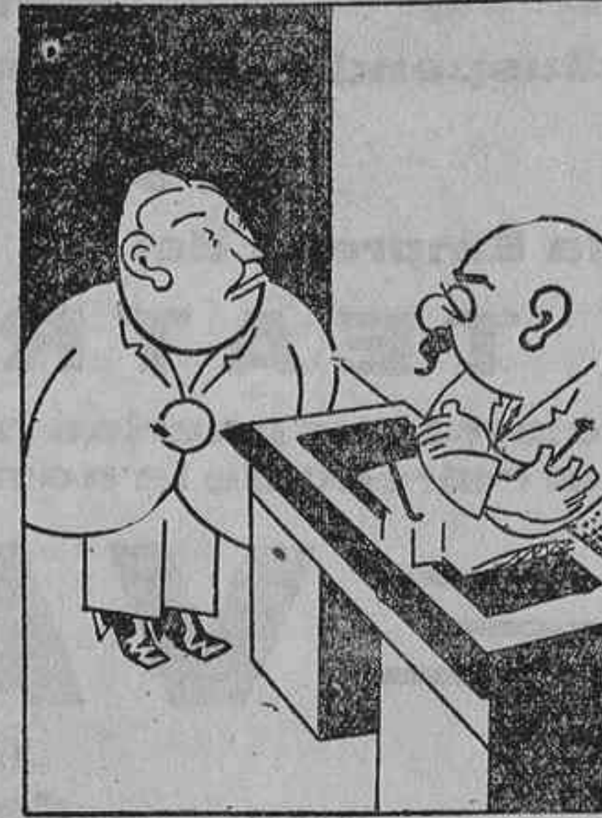
—Y es costumbre, además, emplear a los reclusos en la profesión que tuvieron antes de entrar aquí. ¿Conformes? —¡Oh, señor director, encantado!