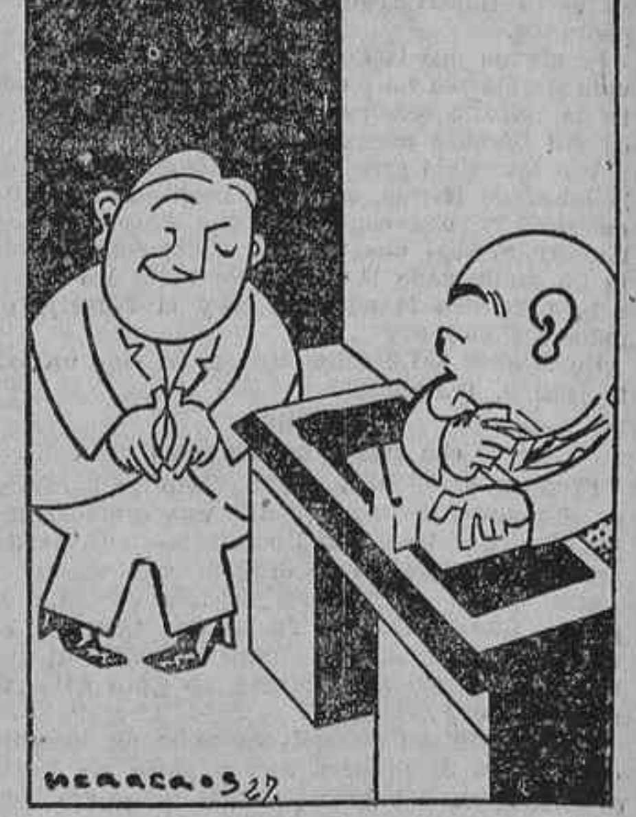
—¿Y usted qué es? —¡Aviador!