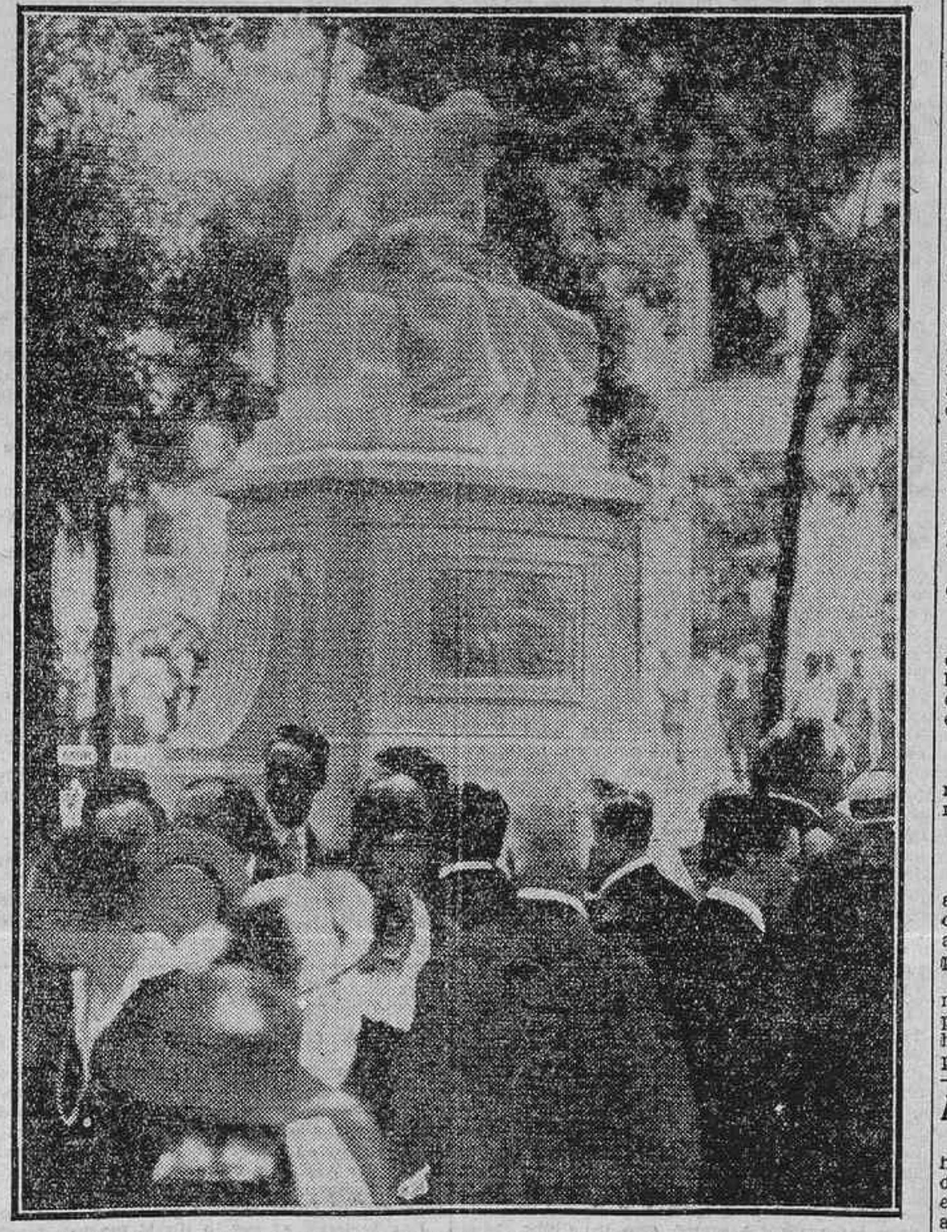
INAUGURACION DEL MONUMENTO ERIGIDO A LA MEMORIA DE LA ILUSTRE ESCRITORA DOÑA EMILIA PARDO BAZAN, VERIFICADA AYER EN LA CALLE DE LA PRINCESA

«Una vez se intenta saber más que yo acerca de mis propósitos. Os ruego hagáis constar que terminantemente no tengo el de ser empresario, ni directa ni indirectamente. Me dedico a trabajar, a preparar lo que quiero estrenar, y que estrenaré sin necesidad de ser empresario.» Queda complacido nuestro buen amigo.