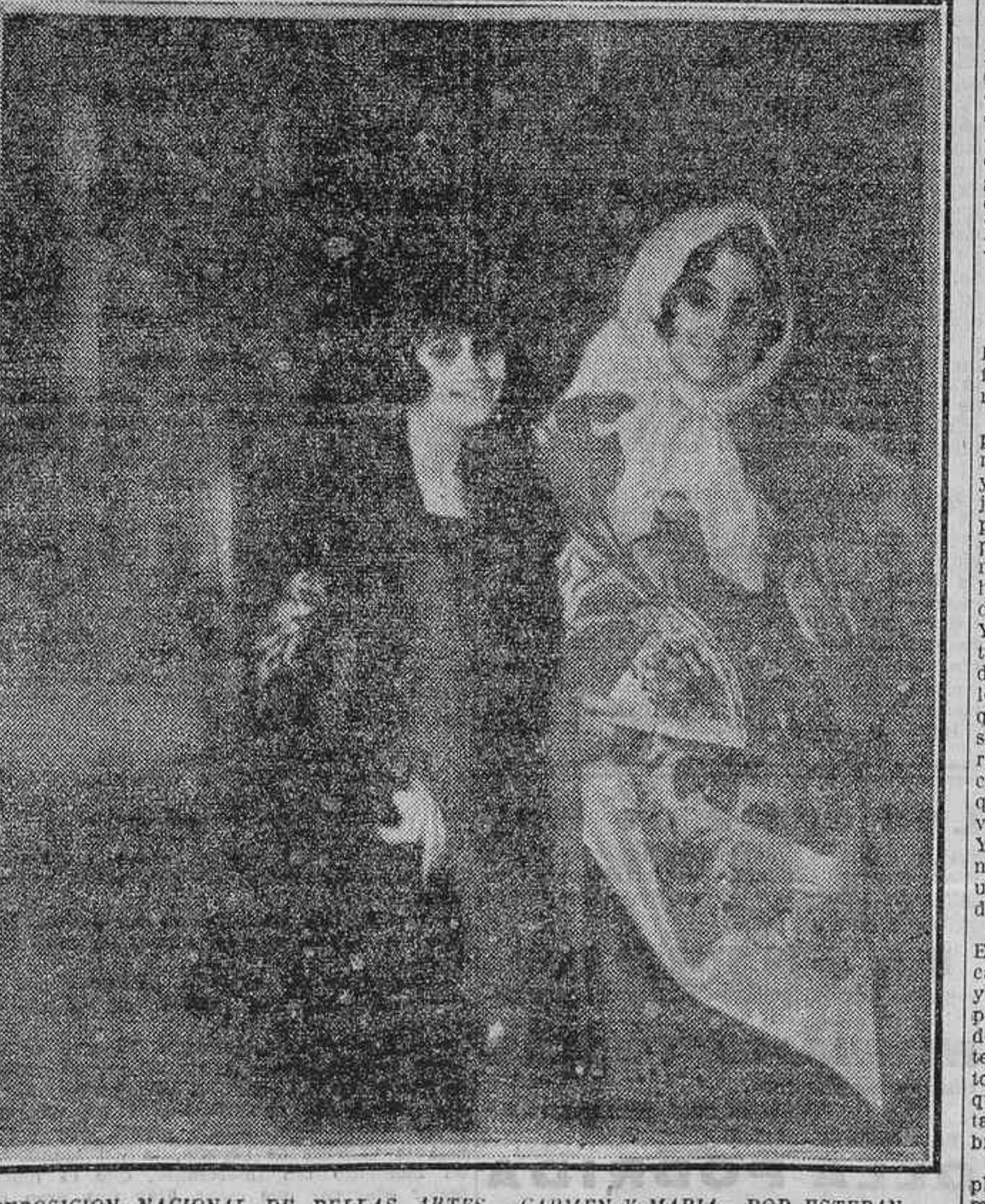
EXPOSICION NACIONAL DE BELLAS ARTES.—CARMEN Y MARIA, POR ESTEBAN DOMENECH

Con estos elementos y el hermoso clima de altura que se disfruta en Carabanchel es de asegurar gran asistencia de forasteros de los pueblos limítrofes y vecinos de la corte, que participarán de tan brillantes fiestas.