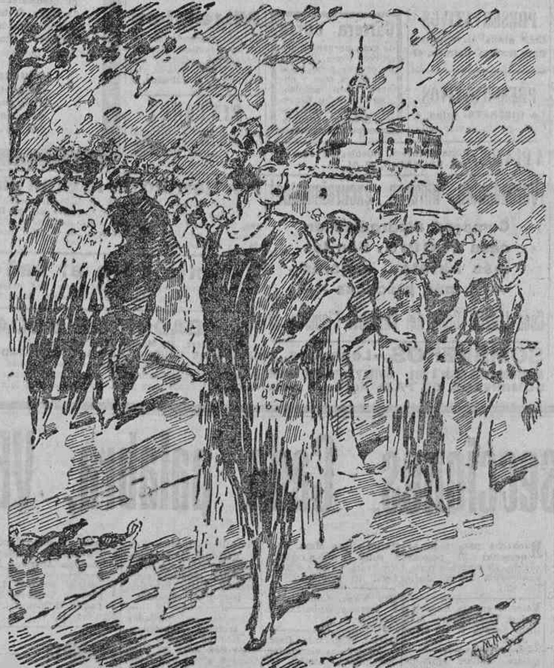
UNA DEVOTA DE SAN ANTONIO, AL QUE LE HA PEDIDO TRES COSAS: UN NOVIO, QUE SEA BUEN MOZO Y QUE NO LA ENGANE