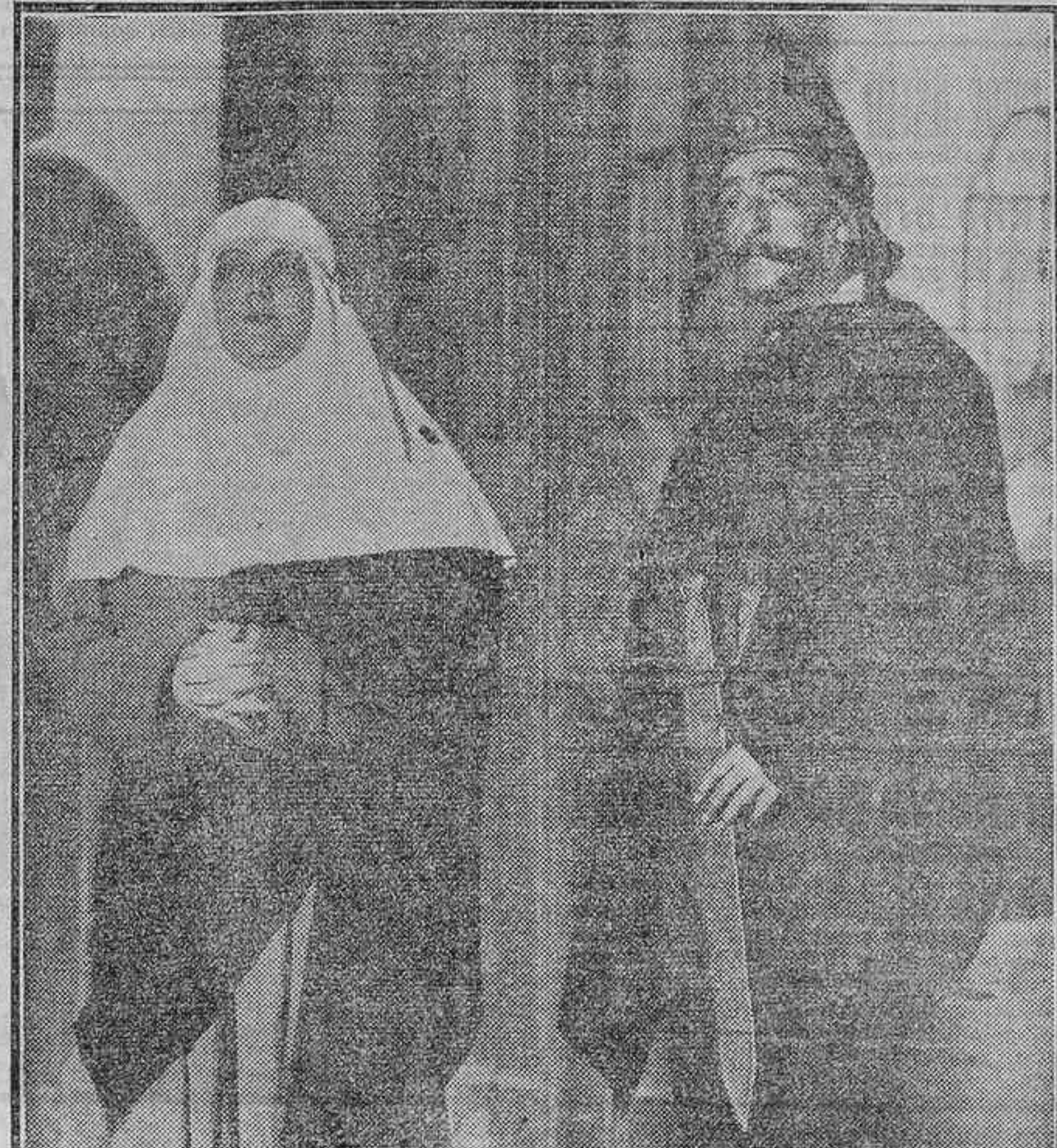
PEPITA MELIA Y BENITO CIBRAN EN LA COMEDIA «LA LEYENDA DE ARENILLAS», DE DIOGENES FERRAND Y ANTONIO JIMENEZ OLIVER, ESTRENADA ANOCHE CON MUCHO EXITO EN EL TEATRO ESLAVA

Londres, 9.—Telegrafían de Tokio al «Times» que la Policía de Corea ha practicado numerosas detenciones con motivo del descubrimiento de un complot revolucionario.