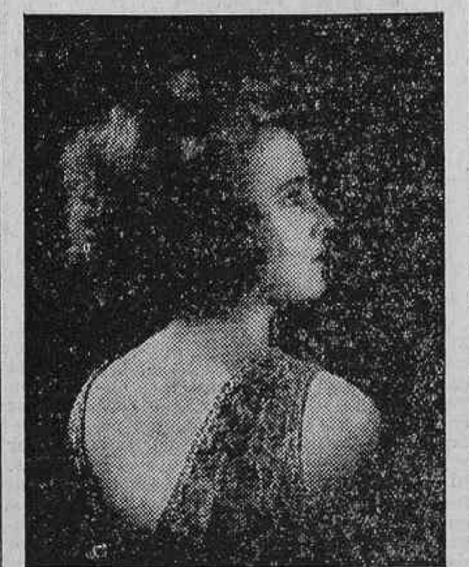
Lillian Harvey, primer premio de belleza en Nueva York, popular estrella

Desde ayer cuenta el público madrileño con un nuevo salón dedicado al espectáculo cinematográfico, pues ayer quedó inaugurado el Cine Madrid, local que parece nuevo. Tal ha sido su transformación, de la cual ya hemos adelantado noticias a nuestros lectores. Cómodo, elegante, suntuoso, el Cine Madrid produjo ayer la admiración del público, que asistió al acto inaugural en proporciones nu-