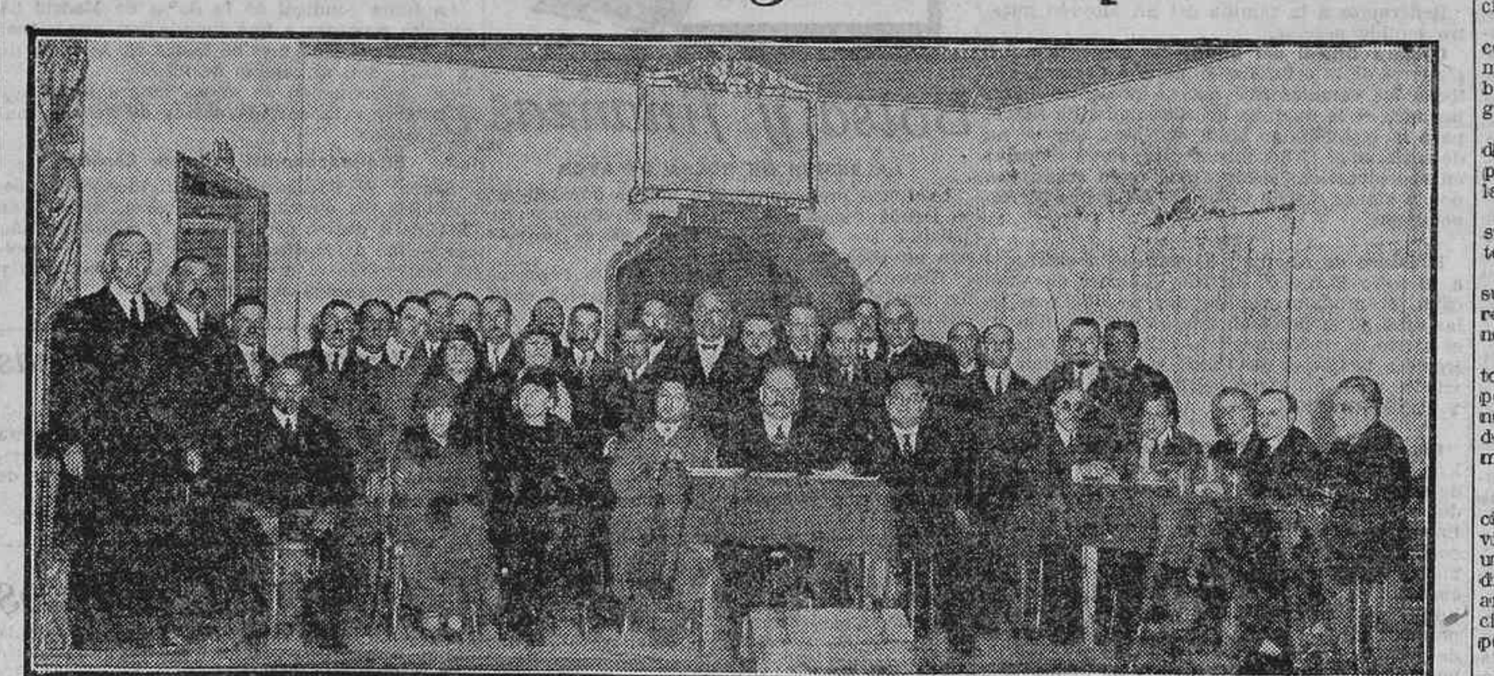
LA PRESIDENCIA DE LA ASAMBLEA DEL MAGISTERIO, QUE AYER INAUGURO SUS TAREAS EN MADRID

A las diez de la mañana del día de ayer, en el teatro Rey Alfonso, se inauguró la Asamblea convocada por la Asociación Nacional del Magisterio.