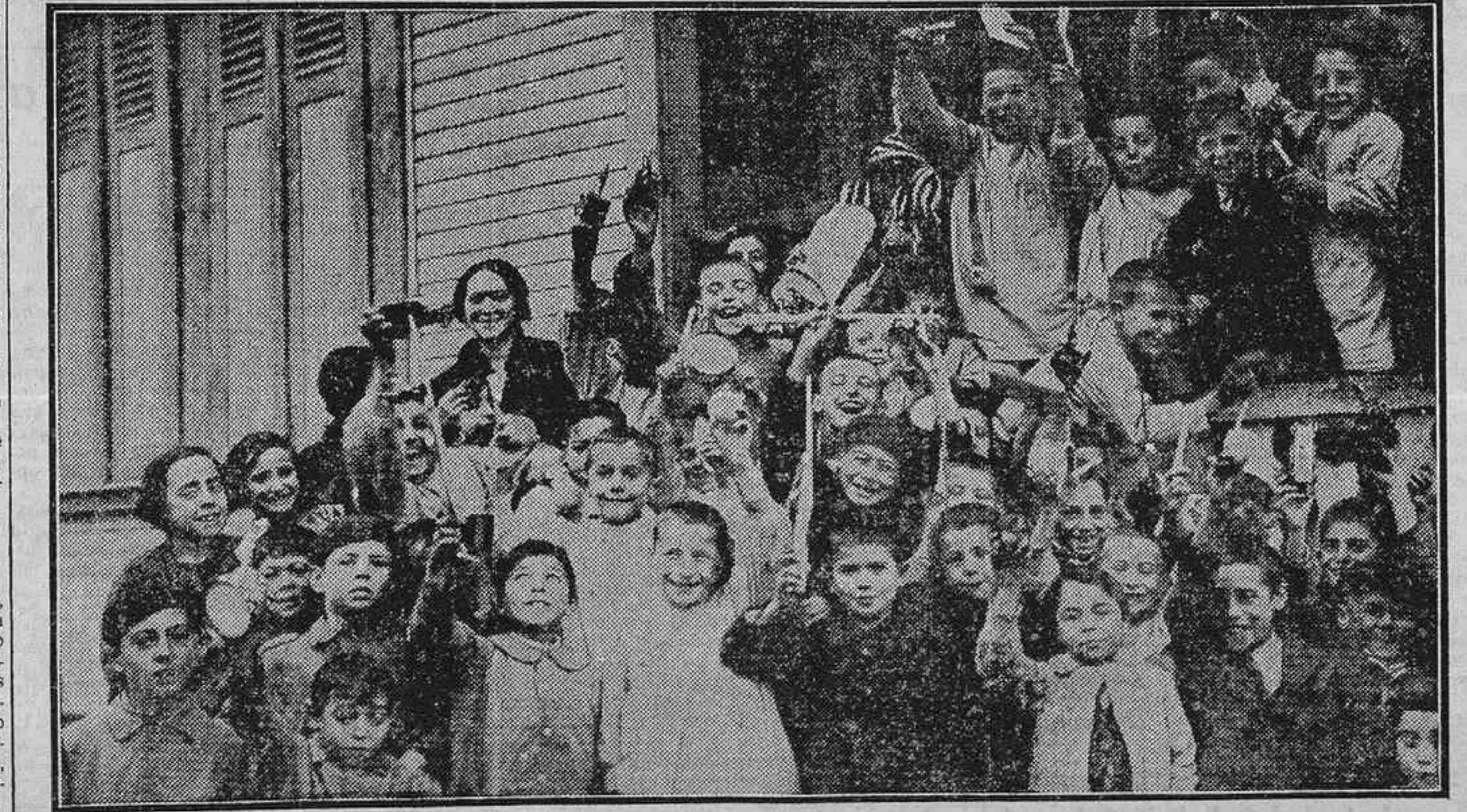
EN EL GRUPO ESCOLAR DEL PASEO DE LOS PONTONES.—GRUPO DE NIÑOS DE LA CIUDAD INFANTIL CON LOS JUGUETES QUE LES REPARTERON AYER, CON MOTIVO DE LAS FIESTAS DE NAVIDAD