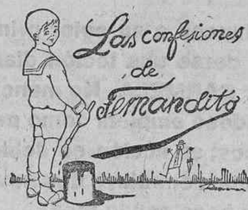
Los confesiones de Fermadeta

ALQUILERES... Señoría sola cede medio piso amueblado.