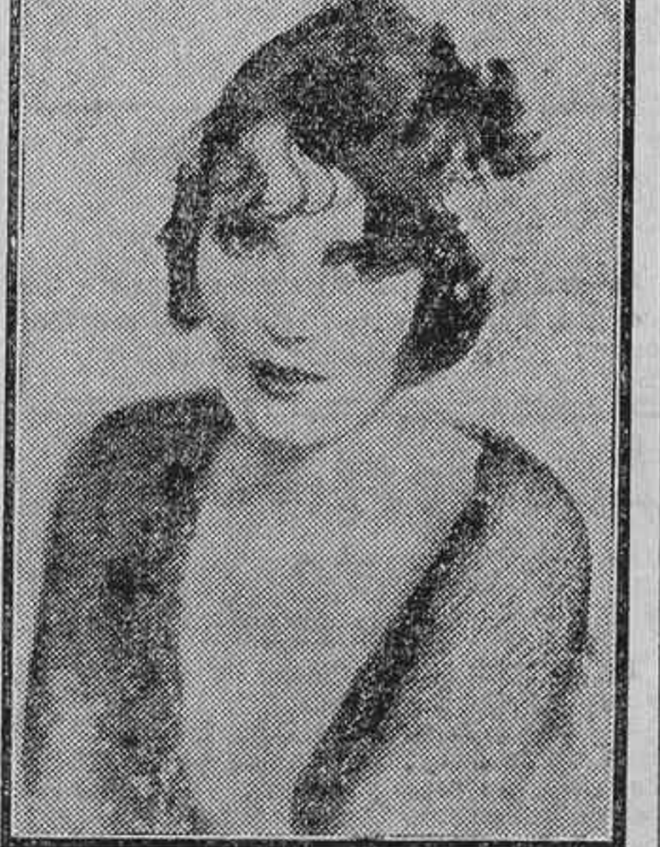
Paulina Starke, artista cinematográfica, bella e inteligente, que ha interesado grandemente al público parisino

Y anteayer, y así hacia fechas de atrás. «Caimanía» se sostiene en su recinto. En pie o sentados los «caimanios», «tanto monta».